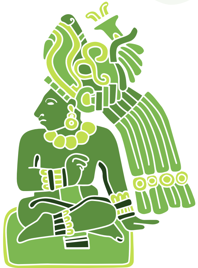
Cédula de objeto de la Maqueta Prehispánica ubicada en la Sala de Introducción del Museo de Sitio de Xochicalco.

Para el año 2019, después de un proceso de fotogrametría, que es en términos sencillos obtener mediante muchas fotografías un modelo digital tridimensional, se obtuvieron diez piezas exhibidas en el museo de sitio de Xochicalco las cuales fueron digitalizadas para incorporarlas a la Aplicación para dispositivos móviles Xochicalco AR, modernizando con esta tecnología también los servicios educativos del museo.