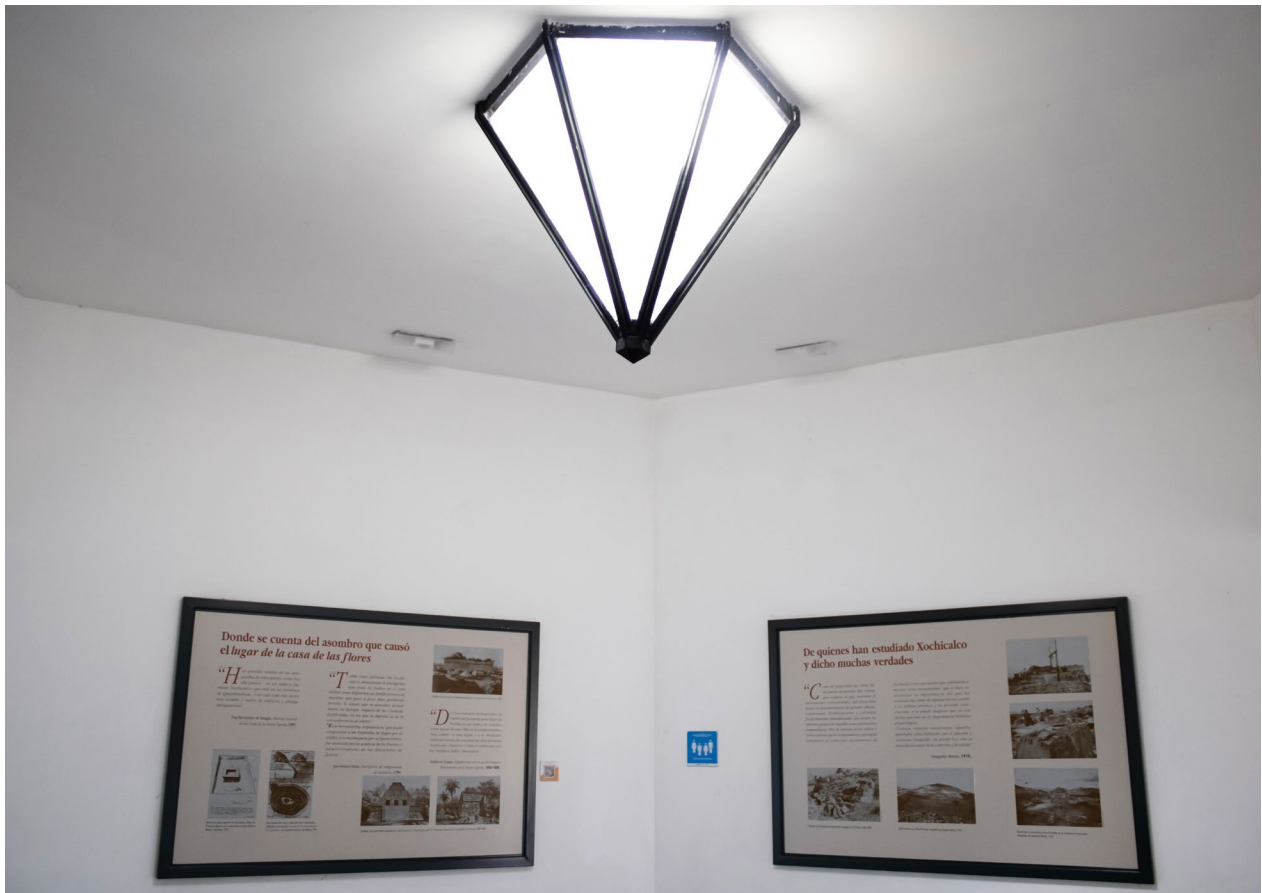
Tubo solar iluminando pasillo cronológico del Museo de Sitio de Xochicalco.

En este punto es importante hablar de cómo fue estructurado el museo, al ingresar nos recibe la sala de introducción y exposiciones temporales con el magnífico ventanal al fondo que nos permite admirar la fachada oriente de la ciudad indígena de Xochicalco, posteriormente iniciamos el recorrido hacia el primer grupo de salas a través del pasillo de las joyas, en donde apreciamos algunas piezas de gran importancia hechas por los Xochicalcas. Llegamos a las primeras salas “Los dones de la tierra, hacedores de vida”, sala “Hombres guerreros, hombres sacerdotes”, y sala “Xochicalco, resguardo de hombres”, para conducirnos ahora a través del pasillo cronológico hacia el segundo grupo de salas “Delicados creadores, monumentales artistas”, “El mundo de los dioses” y “Espacios cotidianos, tiempos de convivencia”. Resalto que el guion del museo de Xochicalco es muy entendible, con lenguaje sencillo y que mediante estudios de público ha sido demostrado que tiene una capacidad de retención de los visitantes de más del 70%, siendo esto un valor muy positivo para un museo.