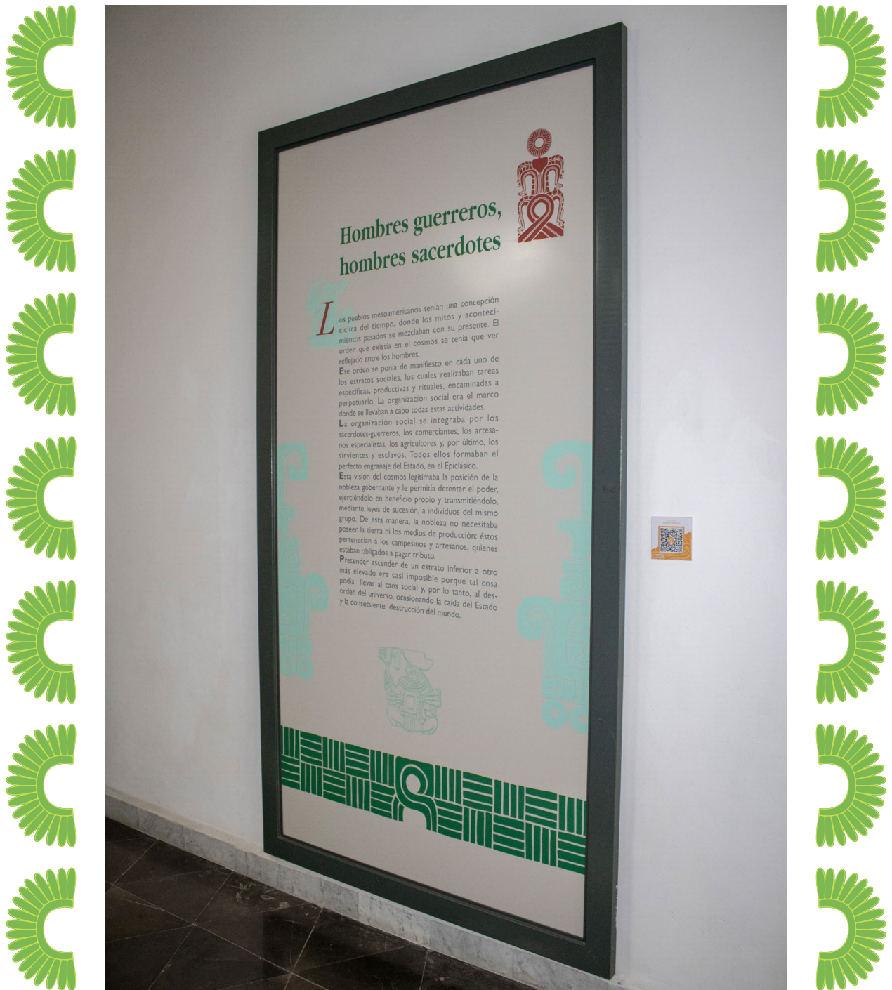
Cédula introductoria de la Sala 2 y código QR de descarga de la información traducida en idioma inglés.

En fechas más recientes, se realizó el trabajo de diseño que hoy en día permite a nuestros visitantes que hablan idioma inglés, que todas las cédulas de salas y las cédulas introductorias, puedan ser conocidas en su idioma conservando el mismo diseño que está ofrecido en español, y esto se logra mediante el enlace del Código QR respectivo.