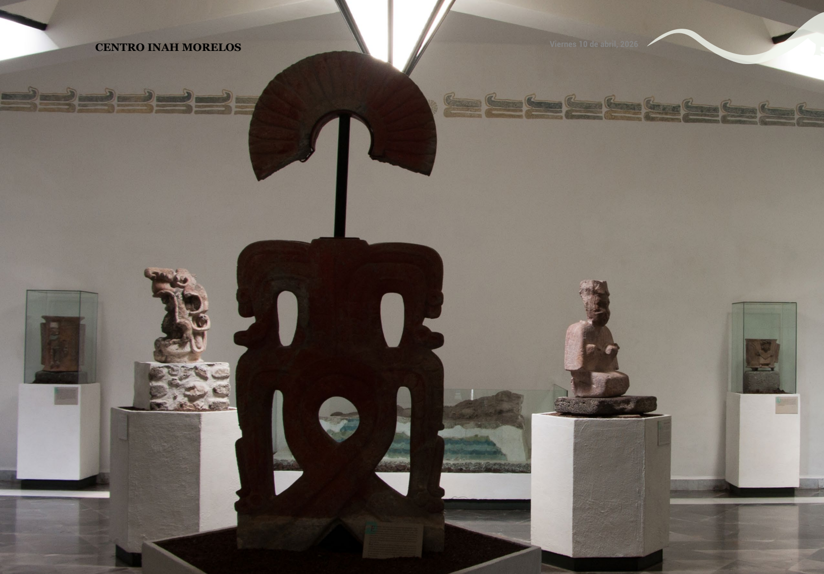
Fotografía: Adalberto Ríos Szalay. Museo de Sitio Xochicalco, 2005. Colección "Archivos Compartidos Tres Ríos". Fototeca "Juan Dubernard". Centro INAH Morelos.