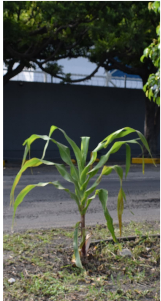
Arriba. Cañuela solitaria. CIVAC. Mor. Fotografía: Luis Miguel Morayta Mendoza, 2025.

"Desde hace tiempo nos llamó la atención ver plantas de maíz en las calles y sus banquetas, así como camellones y en macetas, fuera o dentro de las casas, con entre una y tres plantas de maíz. Aunque mucho del crecimiento de estas plantas se da en época de lluvia no faltan algunas que son regadas desde su brote, hasta cuando ya está dado elotes. A veces las he encontrado amarradas a un poste o aun puesto de periódicos. Es decir, las que brotan en la calle sea porque alguien las plantó o simplemente cayeron accidentalmente algunos maíces en la tierra, comúnmente la gente no las corta como si fueran cualquier yerba que estorba". (Morayta, suplemento, 1126 ) En muchos de los casos los creadores de estas milpas igual que muchos de los murales callejeros son anónimos. Lo que se percibe es que hay sentimientos que motivaron a cuidar, a proteger y a ver con emoción, estas extraordinarias plantas.