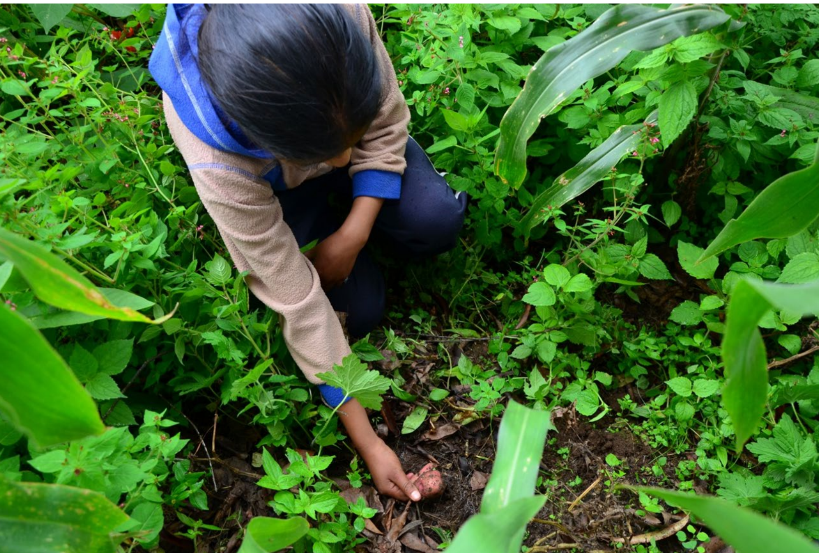
Cultivando desde niña, Malintepic, Guerrero.