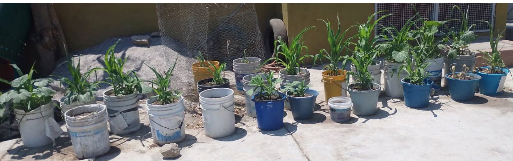
Inicio de la Milpa de las niñas los niños del preescolar. Tetlama, Morelos.