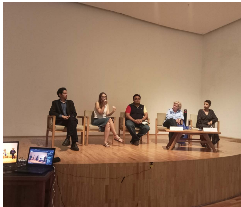
Sesión de preguntas, ponentes mesa 2. Análisis artístico e iconográfico.