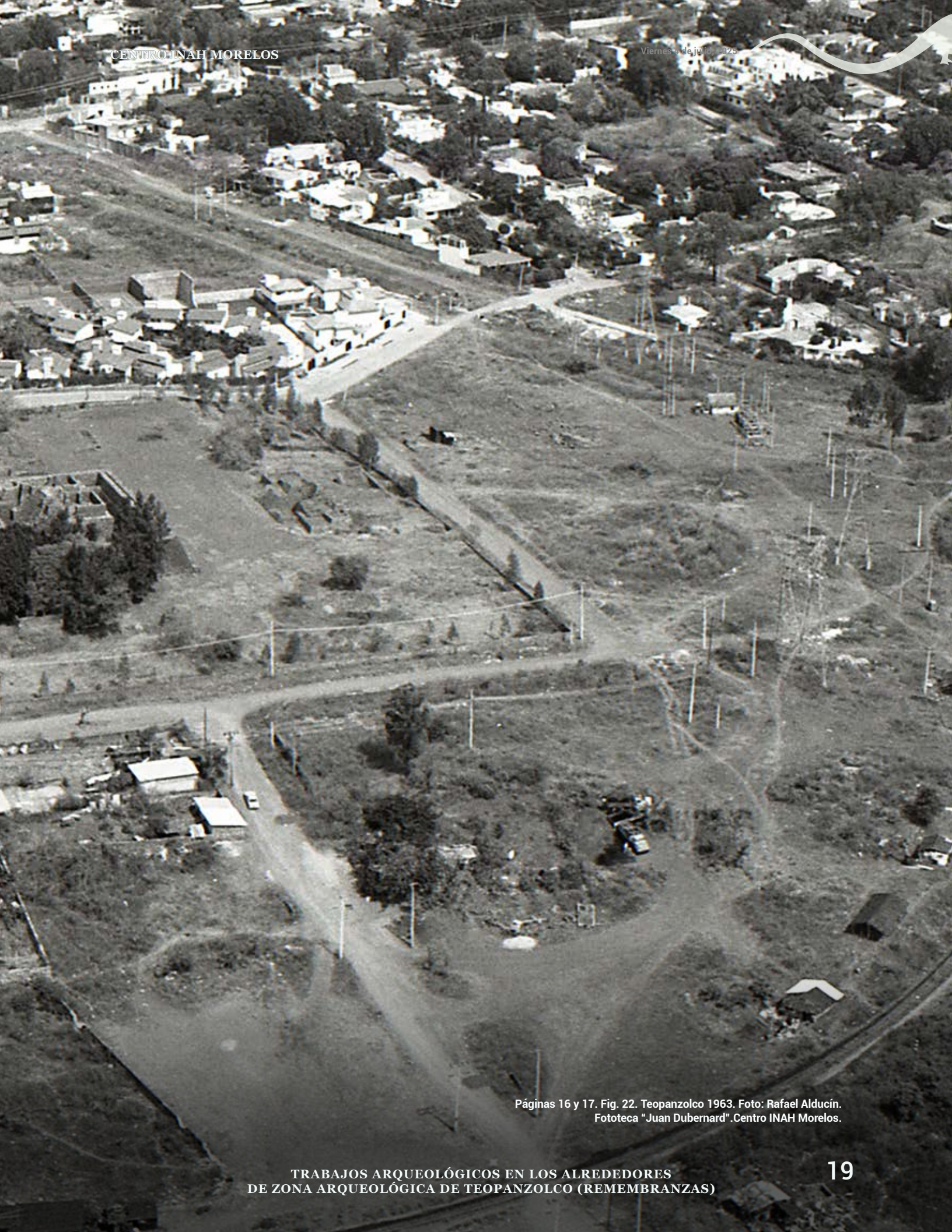
Páginas 16 y 17. Fig. 22. Teopanzolco 1963.