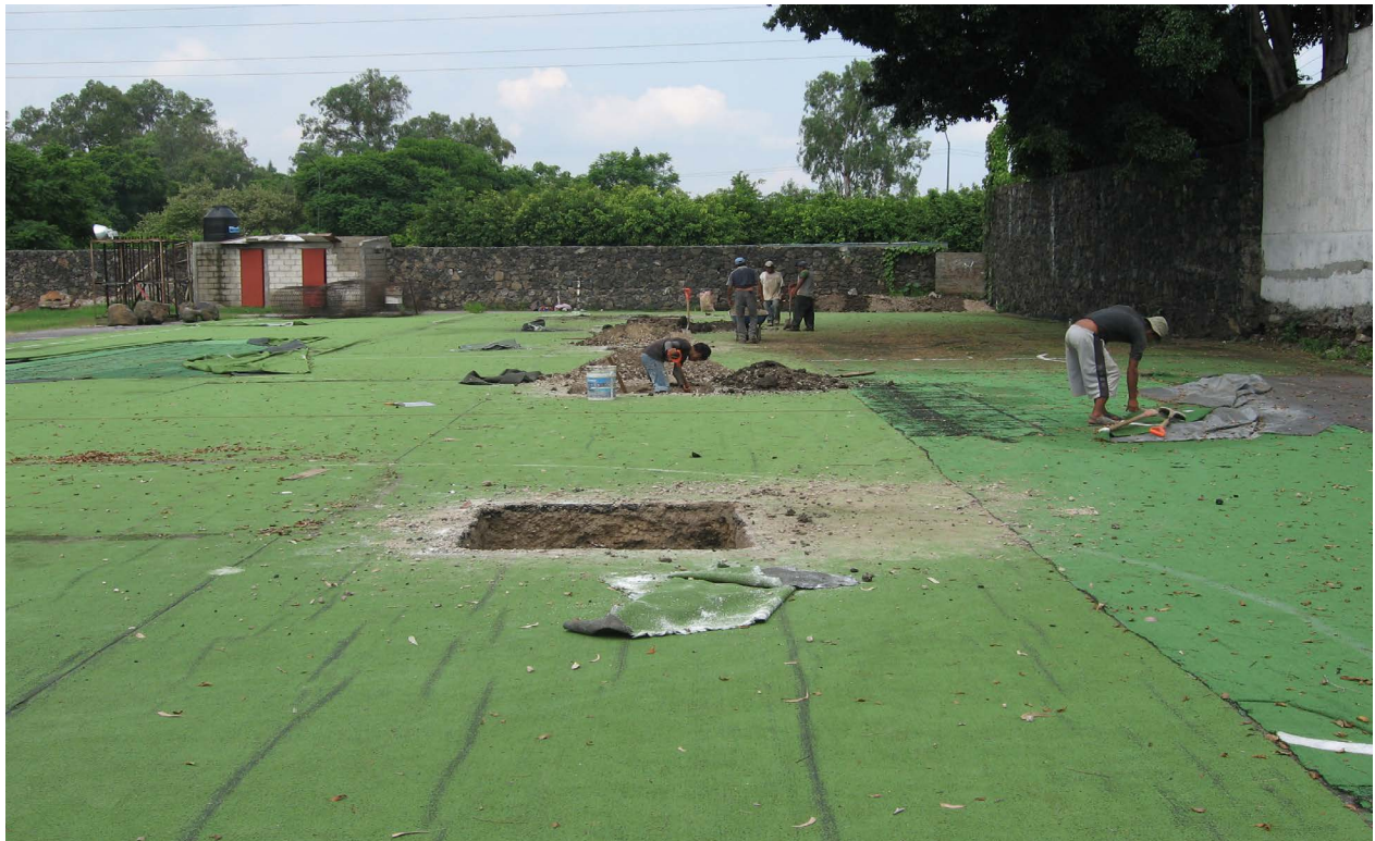
Abajo - izquierda: Fig. 10. Trabajos arqueológicos en el predio Corporativo Pirámide.