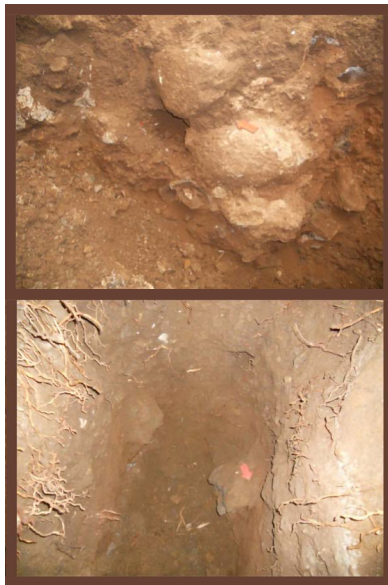
Arriba. Fig.26. Piedras careadas dentro de dos pozos estratigráficos en Auditorio.

El antiguo asentamiento de Teopanzolco era extenso, como lo pudimos constatar a través de los trabajos arqueológicos en su periferia. La suerte de las zonas arqueológicas en contexto urbano es muy distinta de los sitios apartados de los centros de población. En el caso de las zonas urbanas es fundamental tener acceso a la información que nos pueden proporcionar los trabajos arqueológicos en los predios colindantes con la zona, porque solo a través de esa información se puede reconstruir la extensión del antiguo asentamiento, su cronología y recoger los materiales que nos hablaran sobre la vida de sus antiguos habitantes. De gran ayuda son también las antiguas fotografías que pueden dar pauta sobre cómo se alteraron los contextos geográficos y que podemos esperar al acudir al rescate arqueológico.