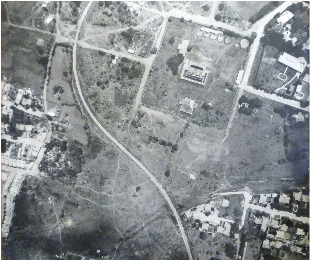
Fig. 2. Teopanzolco en 1975.

En los inicios de los años 80-tas, los arqueólogos Silvia Garza Tarazona, Norberto González y Pablo Mayer Guala realizaron un rescate arqueológico en el terreno donde se edificaron casas habitación, sin estar incluido el terreno del OXXO. Los trabajos proporcionaron materiales arqueológicos que según la descripción procedían del escombro retirado de la zona arqueológica de las excavaciones realizadas en el año 1968 y también de la limpieza del Gran Basamento del año 1921. No se encontraron durante aquel rescate restos de vestigios prehispánicos, por lo que se liberó el terreno para la construcción de las casas habitación.