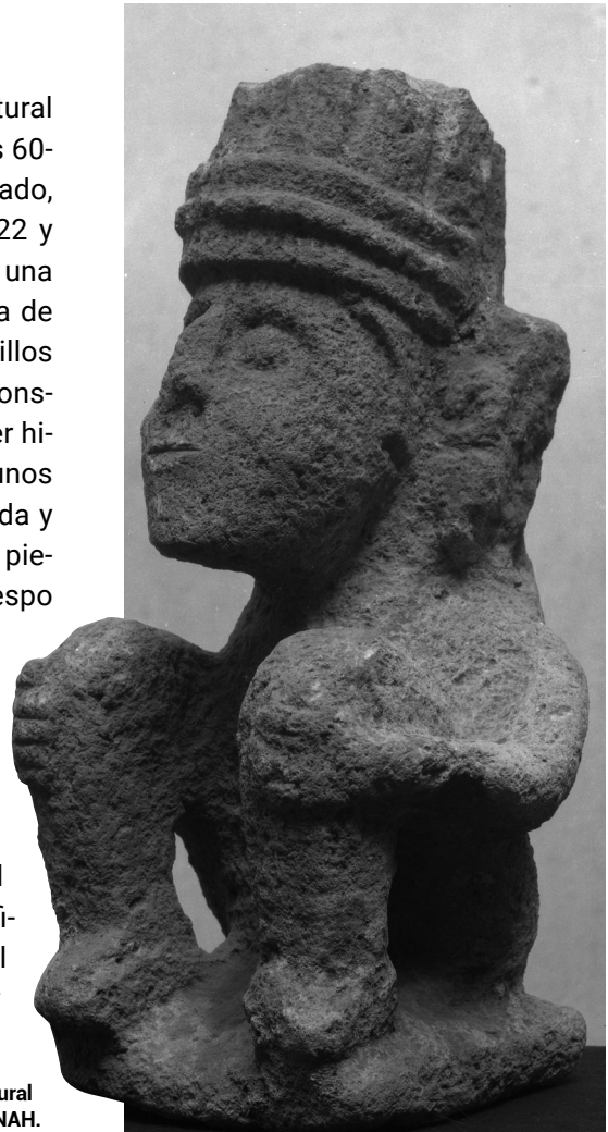
Fig. 24. Escultura de piedra procedente del predio Centro Cultural Teopanzolco.

En el año 2014 se inició la construcción del nuevo Centro Cultural Teopanzolco, desarmando la vieja estructura. Aprovechando esos trabajos, los arqueólogos del INAH realizaron la excavación de varios pozos estratigráficos en la parte frontal, lateral y posterior del espacio del viejo auditorio. Además, se usó georradar para escanear toda la superficie donde iba ser asentado nuevo edificio.