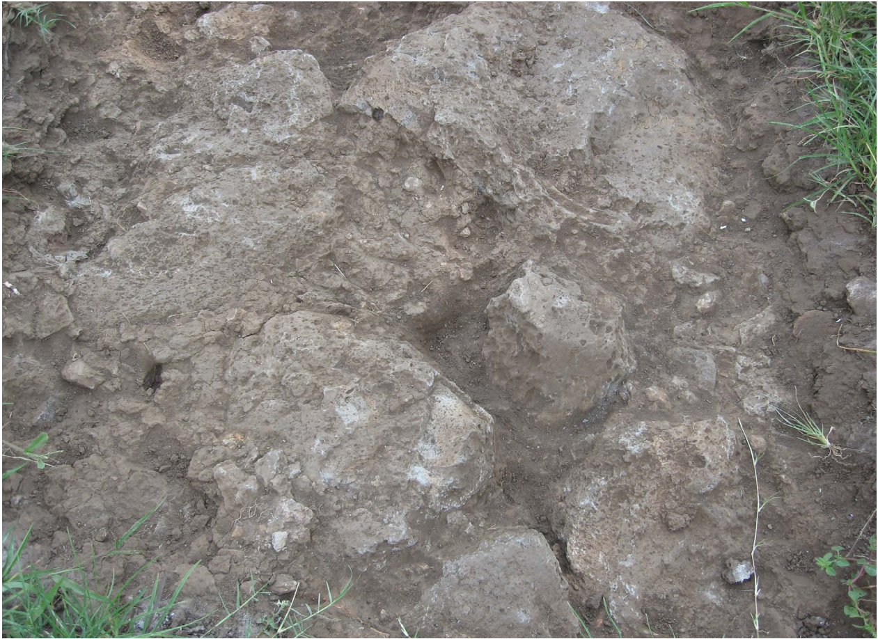
Arriba. Fig.18. Uno de los pozos estratigráficos de estacionamiento de Sport City. Abajo. Fig. 19. Piedras con corte dentro de un pozo estratigráfico de estacionamiento de Sport City.