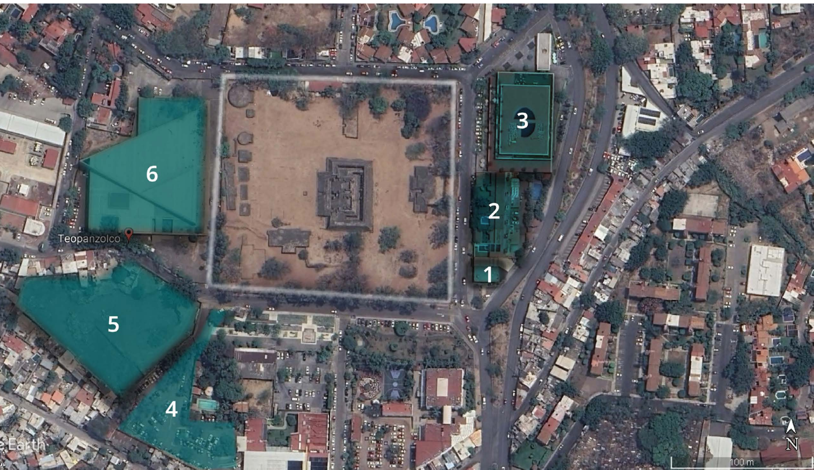
Fig. 1. Predios intervenidos arqueológicamente. Google Earth.

Cabe recordar que en el año 1939 se crea el Instituto Nacional de Antropología e Historia y entre sus principales funciones se encuentra proteger patrimonio cultural, de la nación bajo la ley incluida en la Constitución mexicana.