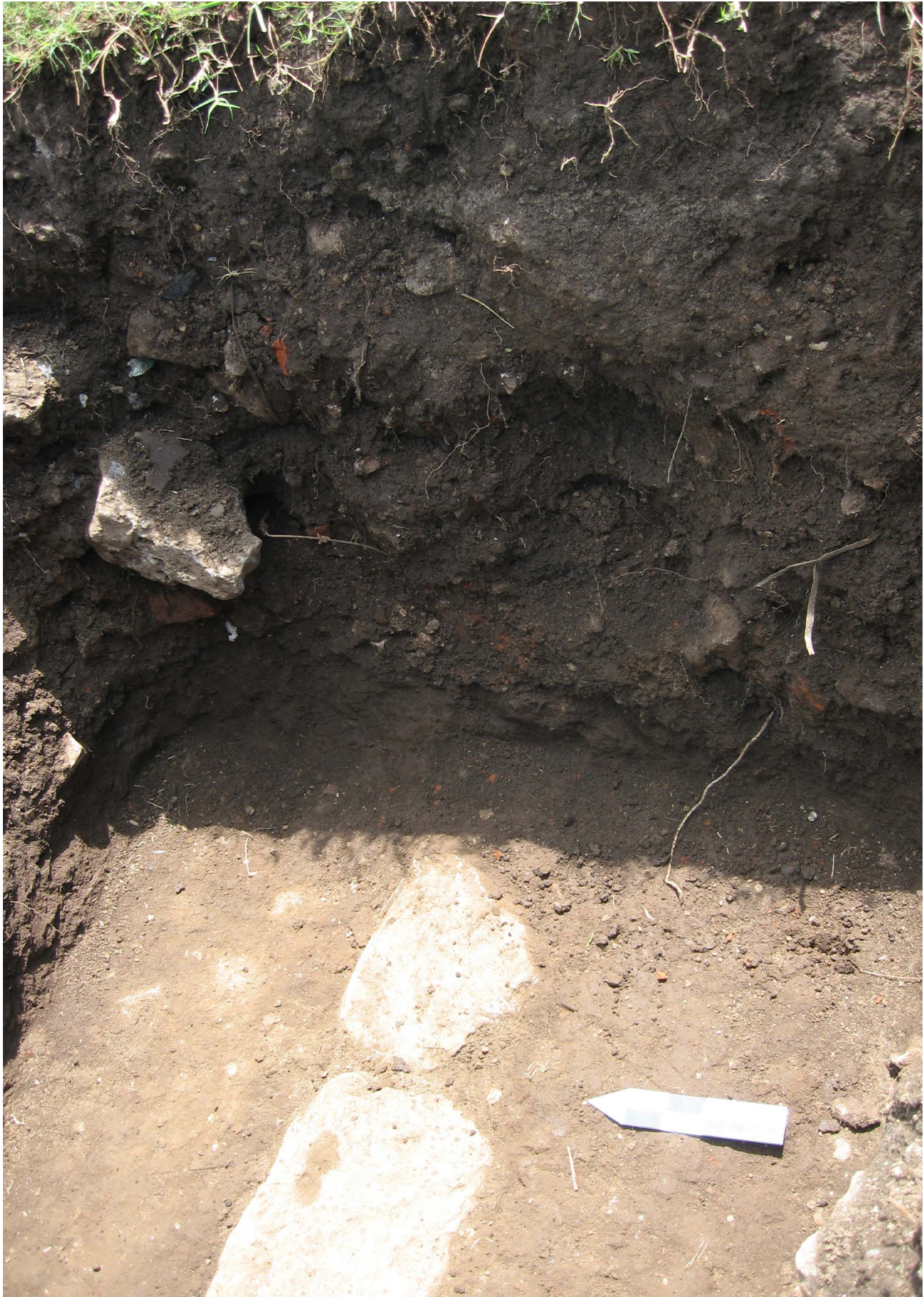
Abajo- derecha: Fig. 11. Corporativo Pirámide. Hilera de piedras prehispánicas en uno de los pozos estratigráficos.