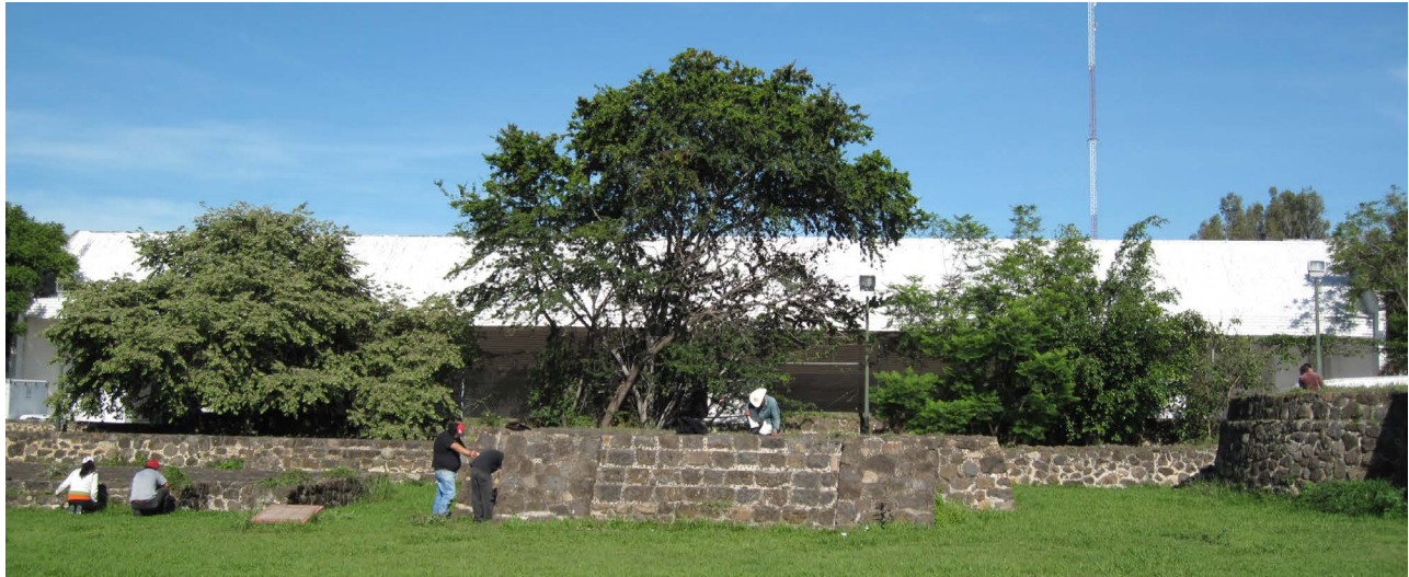
Fig. 25. Auditorio Teopanzolco año 1983.

Se confirmó que en dos pozos había evidencia de algunas piedras careadas y tiestos cerámicos (Fig.26). No había presencia de ninguna estructura prehispánica integra sepultada. El Centro Cultural Teopanzolco se construyó de la manera similar como Corporativo Pirámide, sin profundizar su cimentación y elevar la construcción sobre una placa de concreto (Fig.27).