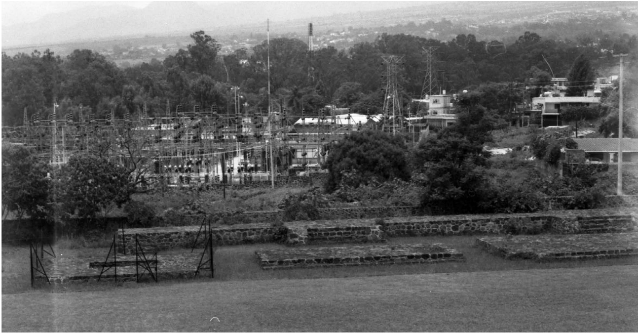
Fig. 23. Predio de Centro Cultural Teopanzolco. Año 1979.