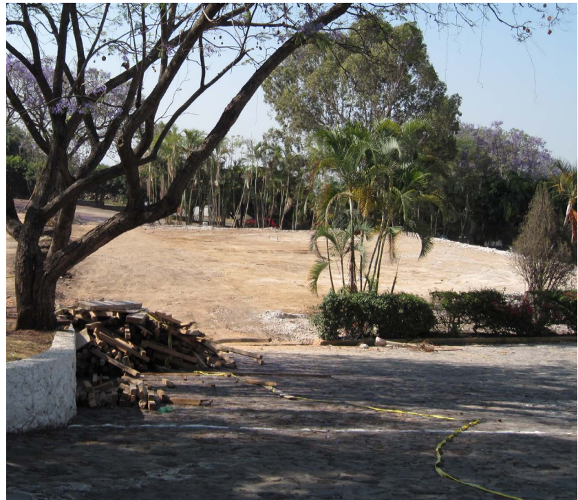
Derecha. Fig.27. Aplanado para construir Centro Cultural Teopanzolco.