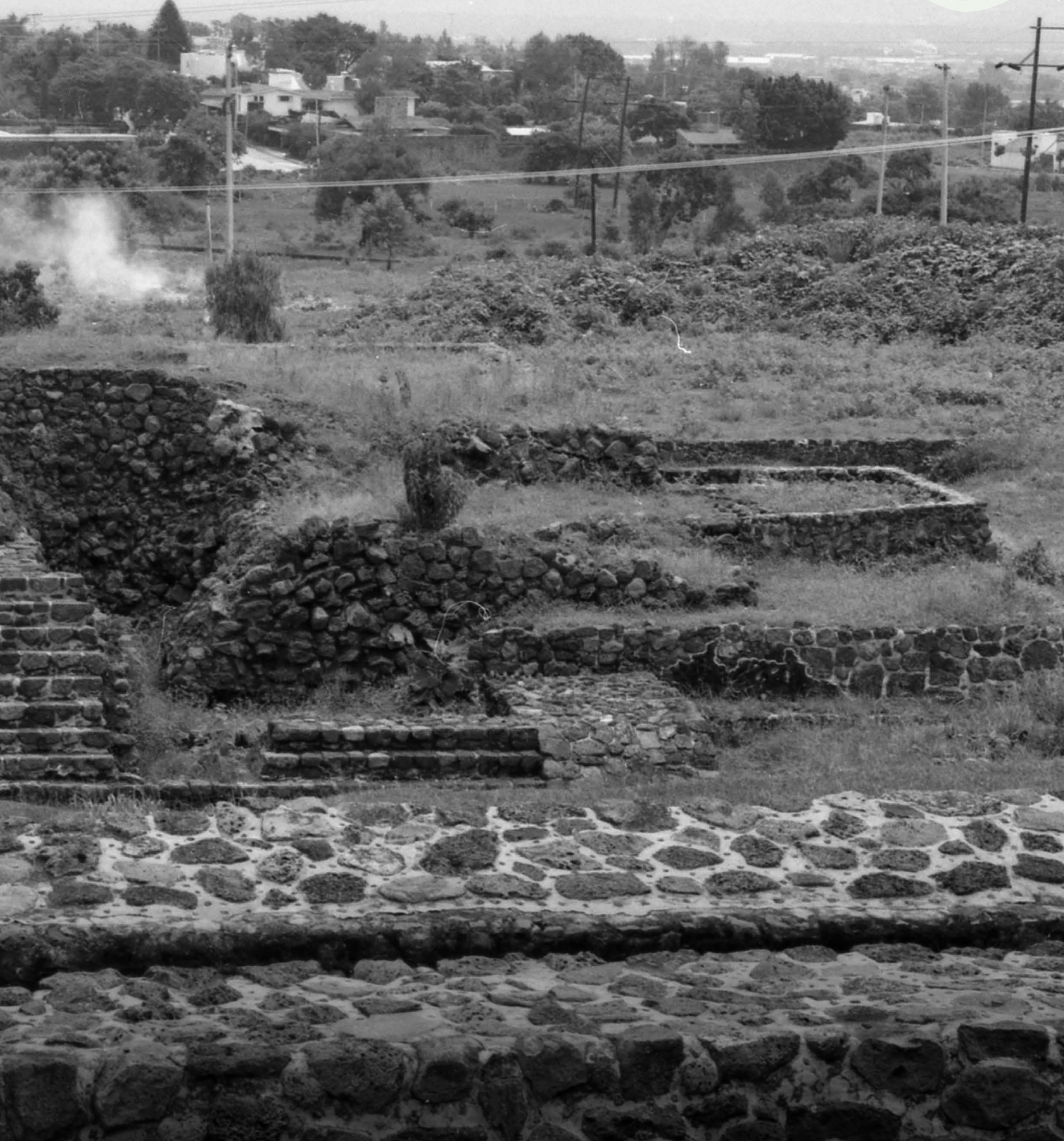
Páginas 8 y 9. Fig. 8. Predio de Corporativo Pirámide. Año 1979.