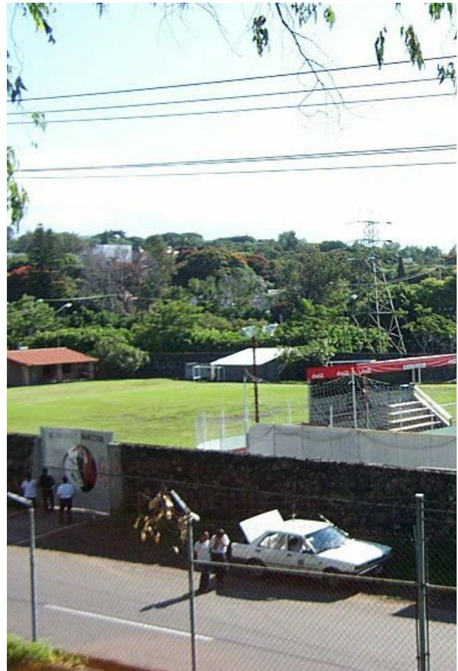
Arriba: Fig. 9. Campo de fútbol en predio Corporativo Pirámide.

En el año 2007 se realizaron trabajos de sondeo arqueológico en el predio donde actualmente se encuentra Corporativo Pirámide (Fig.1- predio 3). En la fotografía aérea del año 1975 (Fig.2) se observa que su superficie del terreno fue nivelada con maquinaria así que no teníamos ninguna evidencia visible de que en este lugar hubiera algunas construcciones prehispánicas. En la Fig.8 que corresponde al año 1979, el terreno se ve cubierto de hierba. En el año 2007, previo a los trabajos arqueológicos, (Fig.9) el mismo terreno fue usado para juegos de fútbol. Los trabajos de sondeo implicaron la excavación de 25 pozos estratigráficos (Fig.10), de los cuales algunos llegaron a las profundidades de hasta 190 cm. En algunos de ellos se encontraron huellas de piedras que pudieron corresponder al algún arranque de los muros prehispánicos, ya destruidos (Fig.11).