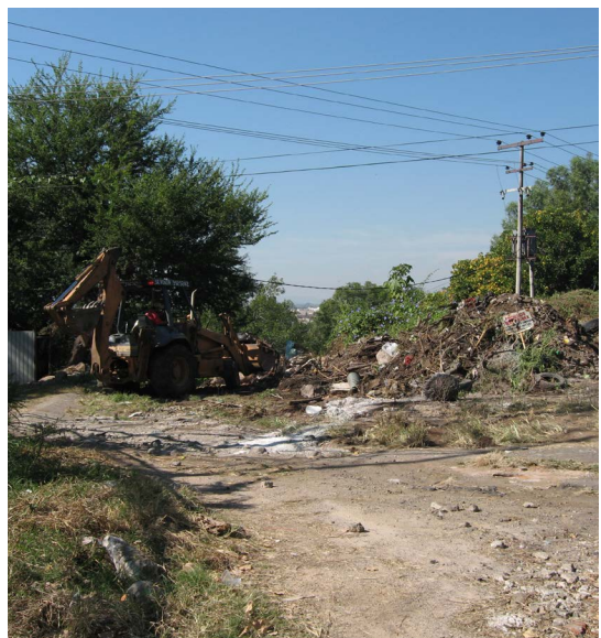
Fig. 16. Afloramientos basálticos en predio de estacionamiento de Sport City.