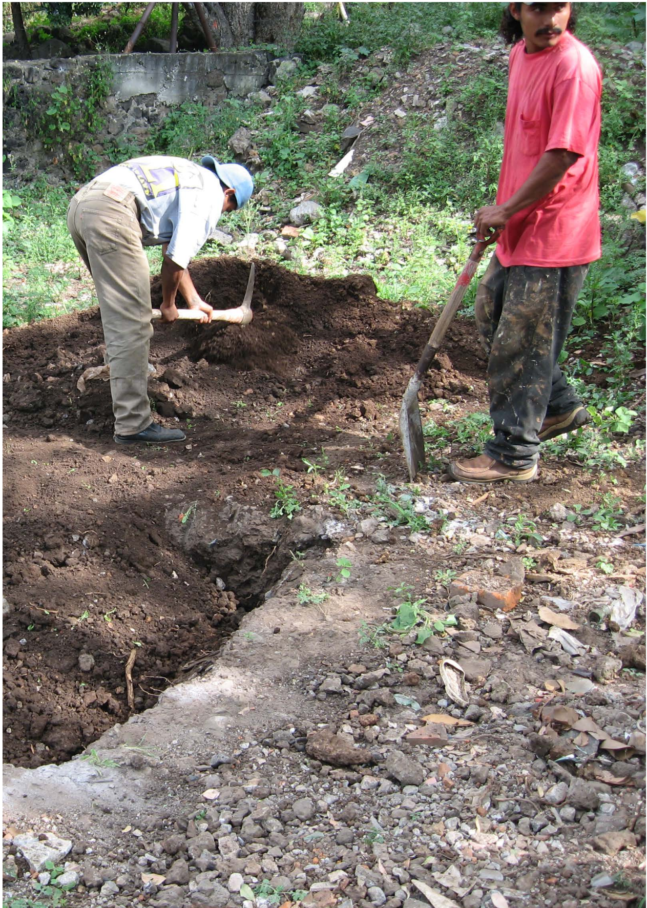
Fig. 17 Excavación de pozos estratigráficos en el predio de estacionamiento.