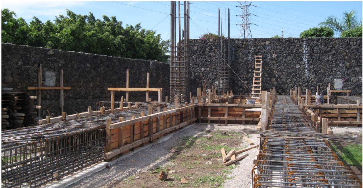
Arriba. Fig. 12. Corporativo Pirámide. Relleno de estrato prehispánico. Abajo. Fig. 13. Corporativo Pirámide. Armado de placa que sostiene edificio.

También se recogió cerámica que después de su análisis se pudo fechar al Posclásico medio. La excavación que se realizó en este lugar, los materiales recogidos y la evidencia de presencia de algunas piedras que provenían de posibles construcciones prehispánicas destruidas previamente, nos permite trazar la extensión del asentamiento prehispánico de Teopanzolco rumbo al Este, hasta lo que actualmente es la Av. Teopanzolco y donde iniciaba afloramiento de grandes rocas basálticas. El edificio del Corporativo se construyó sobre una placa de concreto armado, extendido sobre una capa de relleno de tierra de un metro de espesor, que lo aislaba del estrato donde se tuvo registro de materiales arqueológicos recolectados durante las excavaciones (Fig.12 y 13).