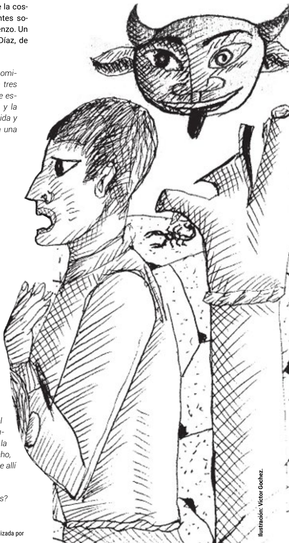
Ilustración: Víctor Gochez.