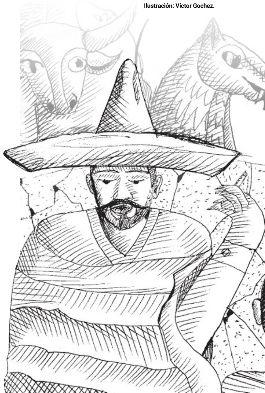
Ilustración: Víctor Gochez.

La figura de Agustín Lorenzo, sigue viva en la memoria de los pueblos que la han custodiado. Pero esta es solo una parte de su historia. En la próxima entrega, el Dr. Resendiz profundizará sobre el origen mítico de Agustín Lorenzo en Tlmacazapa, donde se dice que hizo un pacto con el diablo que le otorgó poderes extraordinarios. ¿Qué secretos guarda esta comunidad sobre su héroe local? ¿Cómo se entrelazan sus hazañas con la defensa del territorio y la resistencia indígena? Acompáñanos a descubrir más sobre este fascinante personaje, cuya historia sigue resonando en algunas comunidades.