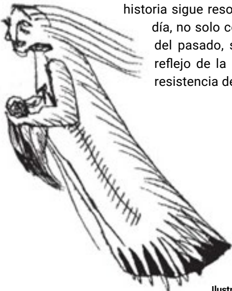
Ilustración: Víctor Gochez.

historia sigue resonando hoy en día, no solo como un relato del pasado, sino como un reflejo de la identidad y la resistencia de los pueblos.