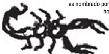
Ilustración: Víctor Gochez.

En el siguiente relato aparece la contradicción, al asumir los indígenas la nueva fe cristiana y conservar simbolismos, valores y rituales de las antiguas creencias, ya que no era fácil de desprenderse de ellas, entre otras razones porque socialmente eran útiles, como en el caso de los rituales propiciatorios de lluvia. En el relato de Pedro Figueroa, de Juliantla, se debe de renegar de los símbolos de la fe cristiana: