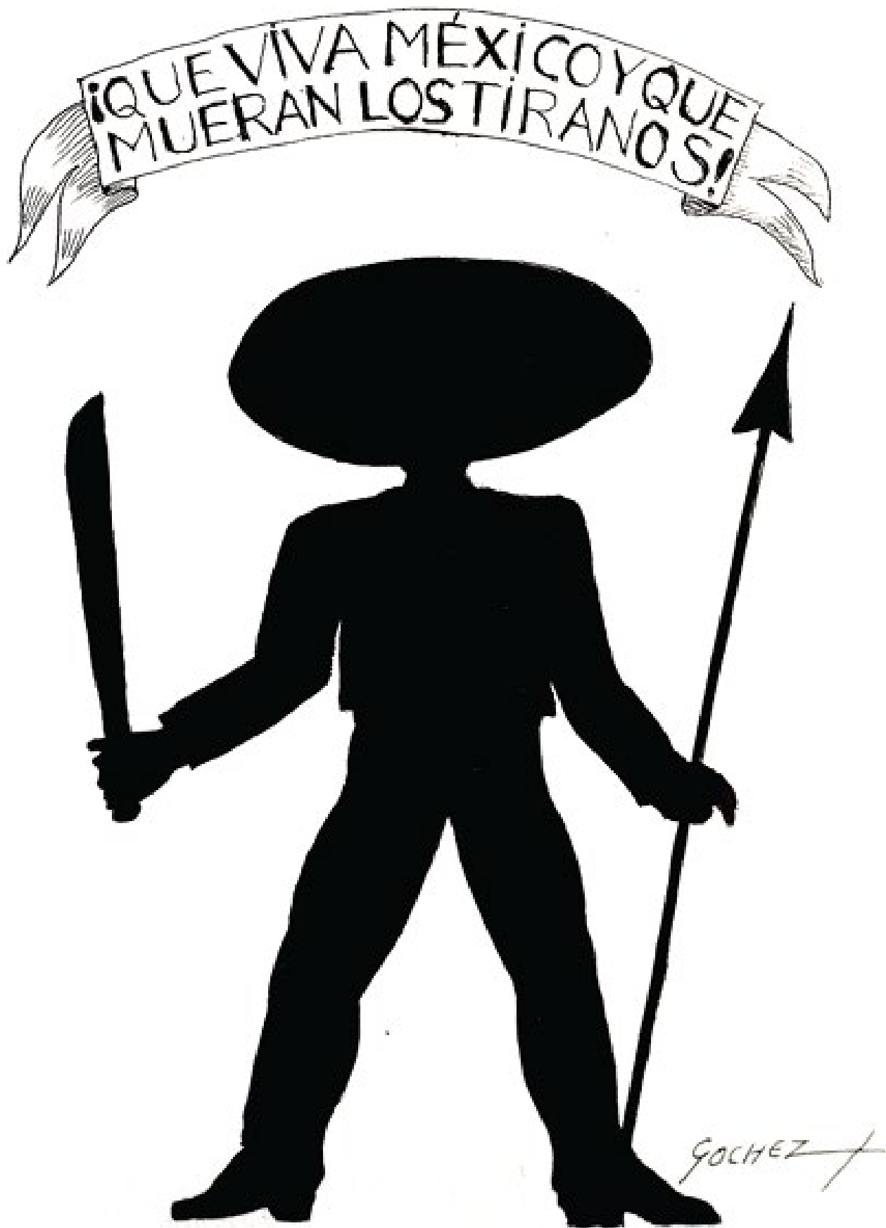
Ilustración: Víctor Gochez.