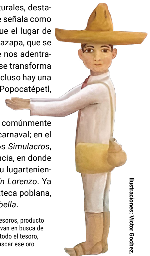
Ilustraciones: Víctor Gochez