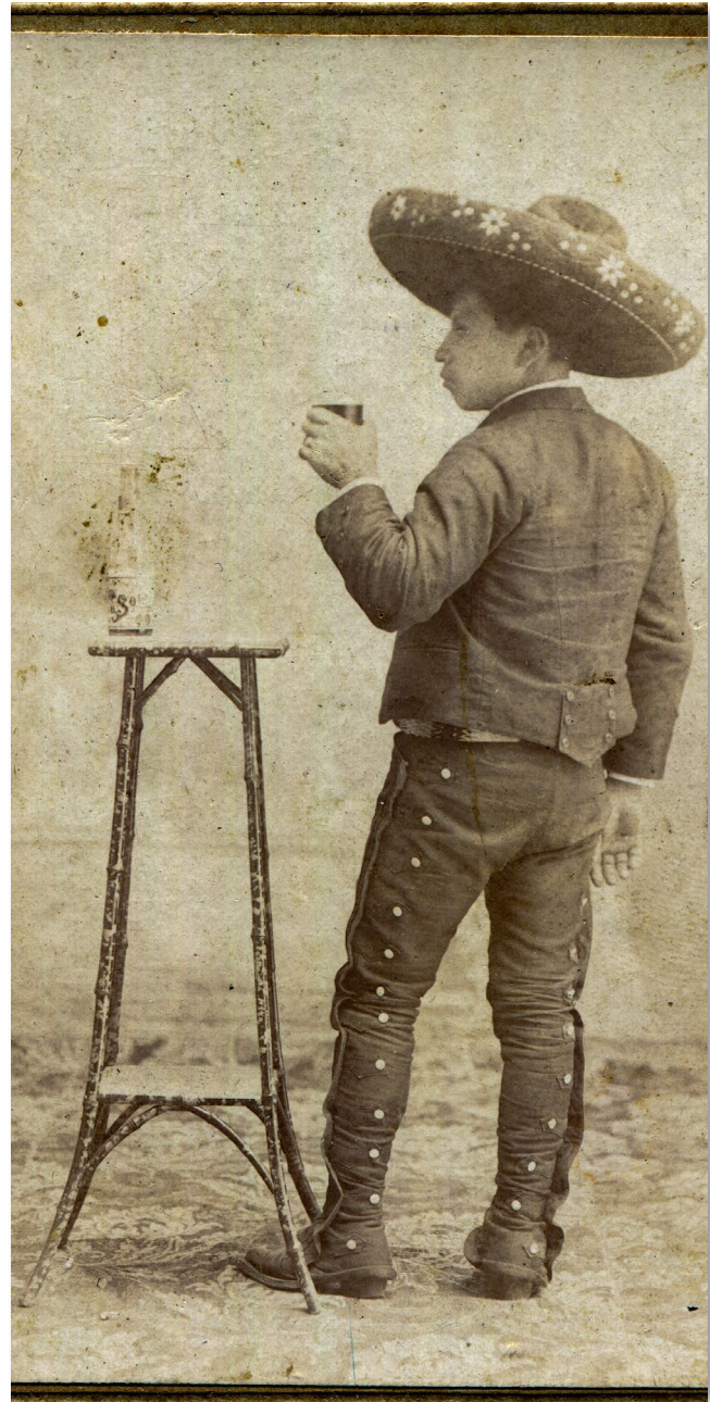
Fotografía: Personaje no identificado. Ca. 1915. ID. 973

Doctor en Desarrollo Rural por la Universidad Autónoma Metropolitana-Unidad Xochimilco. Docente de la Universidad Autónoma del Estado de Morelos.