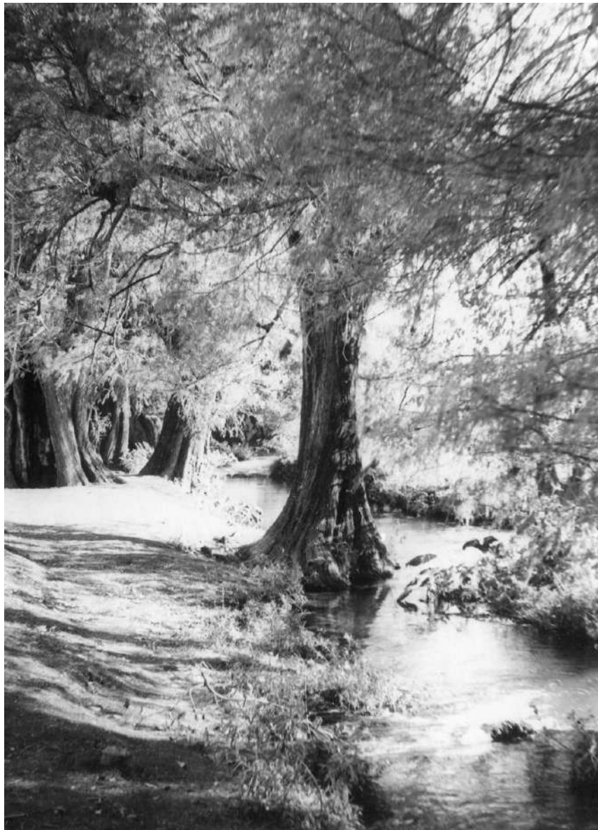
Canal de agua y vista parcial de las Fuentes de Jiutepec, hoy balneario. Morelos, México. Ca. 1960.