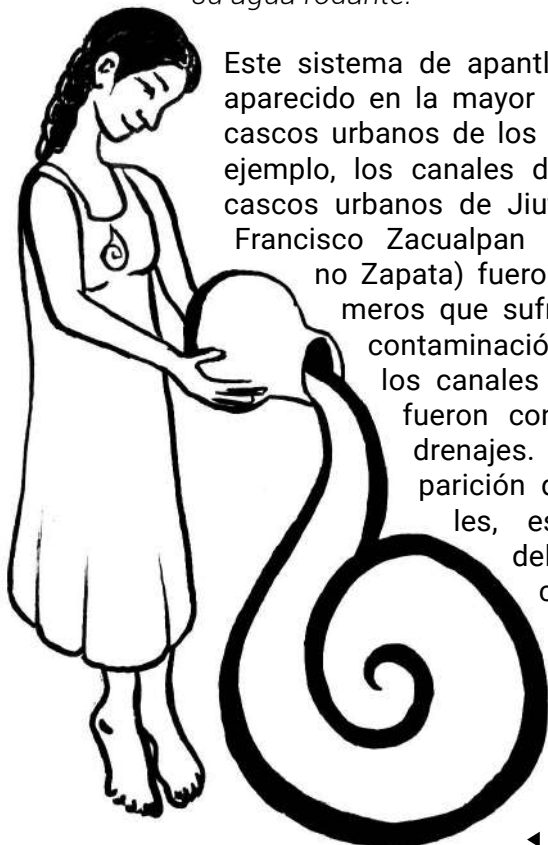
◀ Dibujo: Mafer Rejón

Este sistema de apantles han desaparecido en la mayor parte de los cascos urbanos de los pueblos, por ejemplo, los canales de los viejos cascos urbanos de Jiutepec y San Francisco Zacualpan (hoy Emiliano Zapata) fueron de los primeros que sufrieron por la contaminación, por lo cual los canales secundarios fueron convertidos en drenajes. Esta desaparición de los canales, es expresión del creciente colapso de la vida comunitaria de los viejos pueblos.