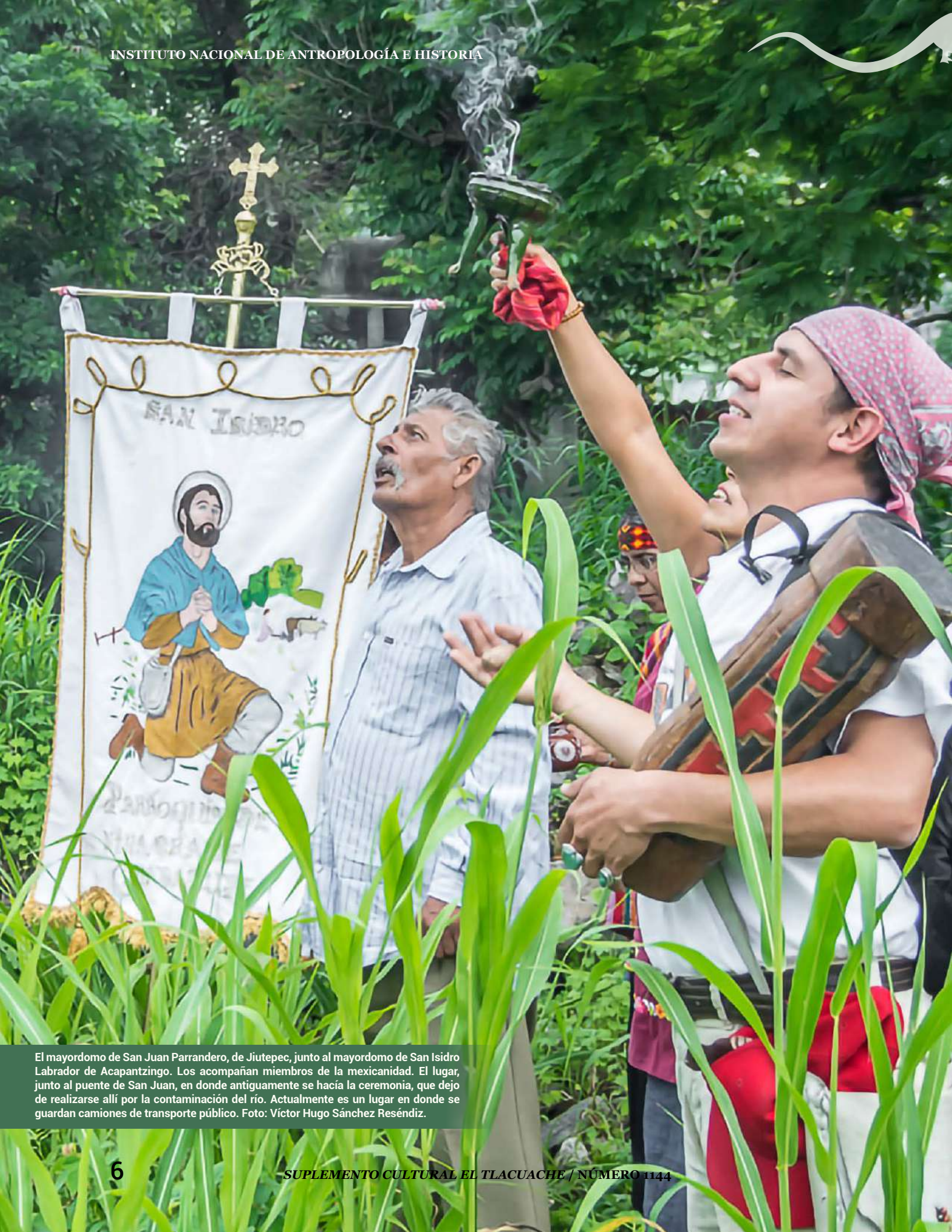
El mayordomo de San Juan Parrandero, de Jiutepec, junto al mayordomo de San Isidro Labrador de Acapantzingo. Los acompañan miembros de la mexicanidad. El lugar, junto al puente de San Juan, en donde antiguamente se hacía la ceremonia, que dejó de realizarse allí por la contaminación del río. Actualmente es un lugar en donde se guardan camiones de transporte público.