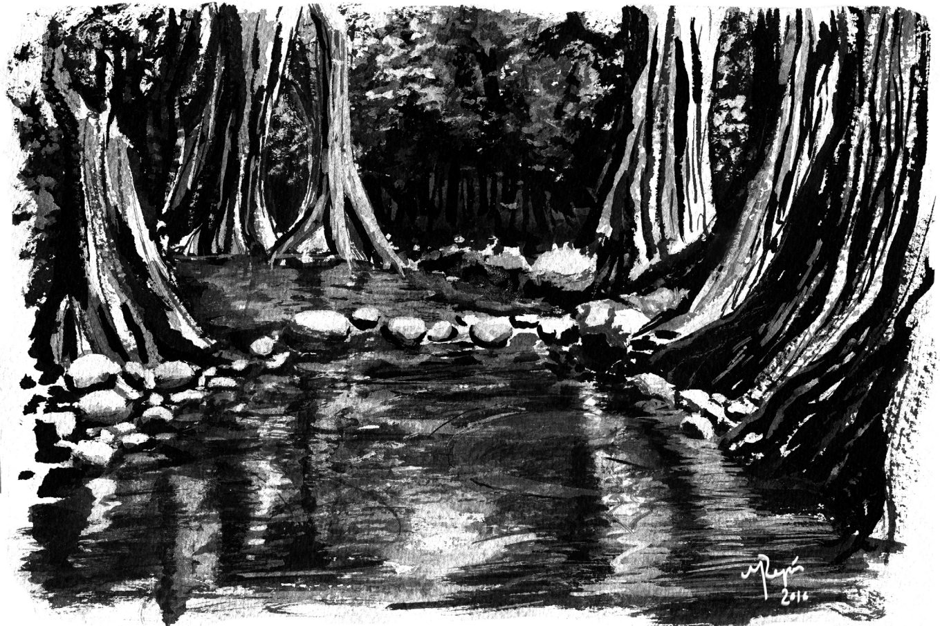
Ahuehuetes y río. Dibujo: Mafer Rejón.

Van Beuren Bruun, Ingrid y Elia Teresa Lazos Ochoa. Procesos y demandas políticas en un pueblo en transición , Tesis para obtener el grado de licenciado en antropología por la UIA, 1976, México.