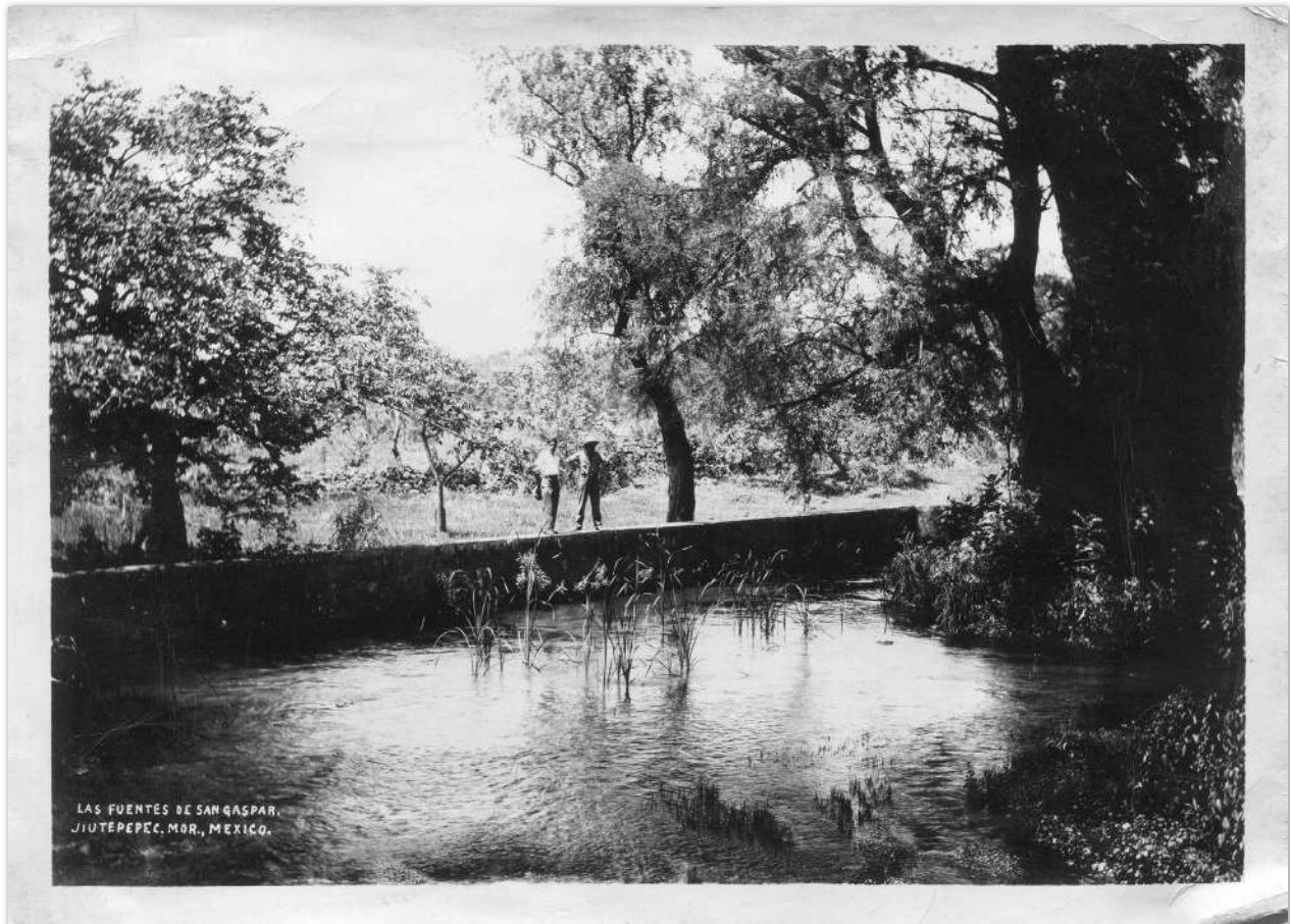
Las Fuentes de San Gaspar. Ca. 1955. Jiutepec, Morelos, México.

Existían varios apantles grandes por Las Fuentes, por la Laguna de Hueyapan, de este lado. Por el lado de colonia Parres también bajaban unos manantiales grandes que de ahí se proveían de agua la mayor parte de las parcelas ¡de agua limpia!