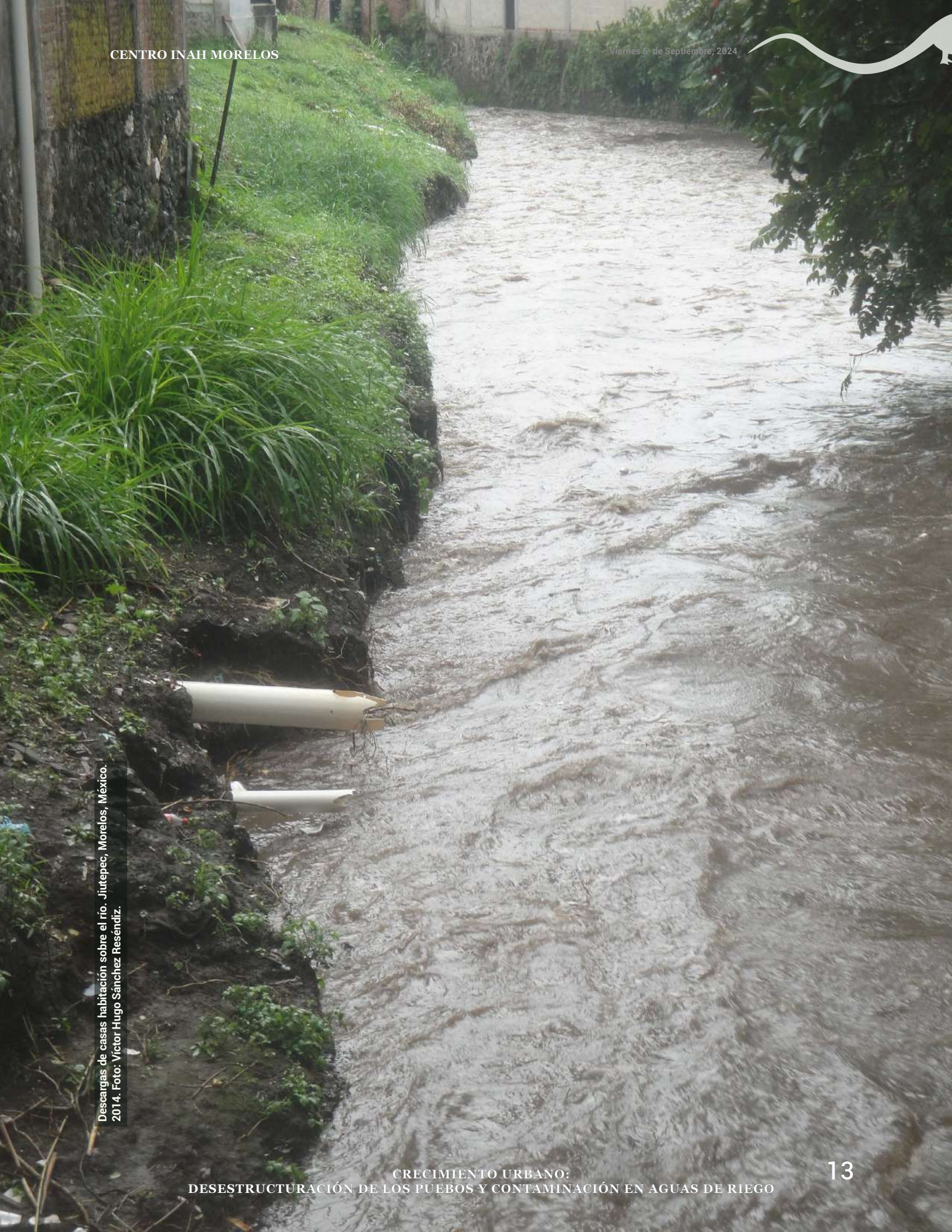
Descargas de casas habitación sobre el río, Jiutepec, Morelos, México. 2014.