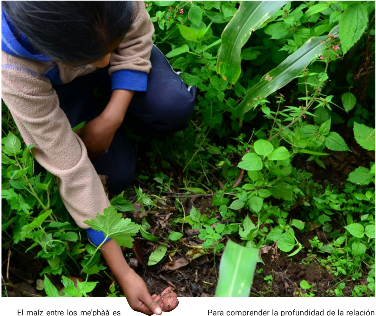
Cosechando papita roja. Malinaltepec, Guerrero, septiembre 2020.

El maíz entre los me'phàà es sinónimo de vida, la semilla, la masa, la tortilla, todo lo que está hecho de maíz no se tira o desperdicia porque esto ocasiona que el maíz abandone a la familia, también si no se agradece a San Marcos o se llevan a cabo los rituales como deben de ser, el maíz puede enfermarse, si esto sucede la gente también enferma: