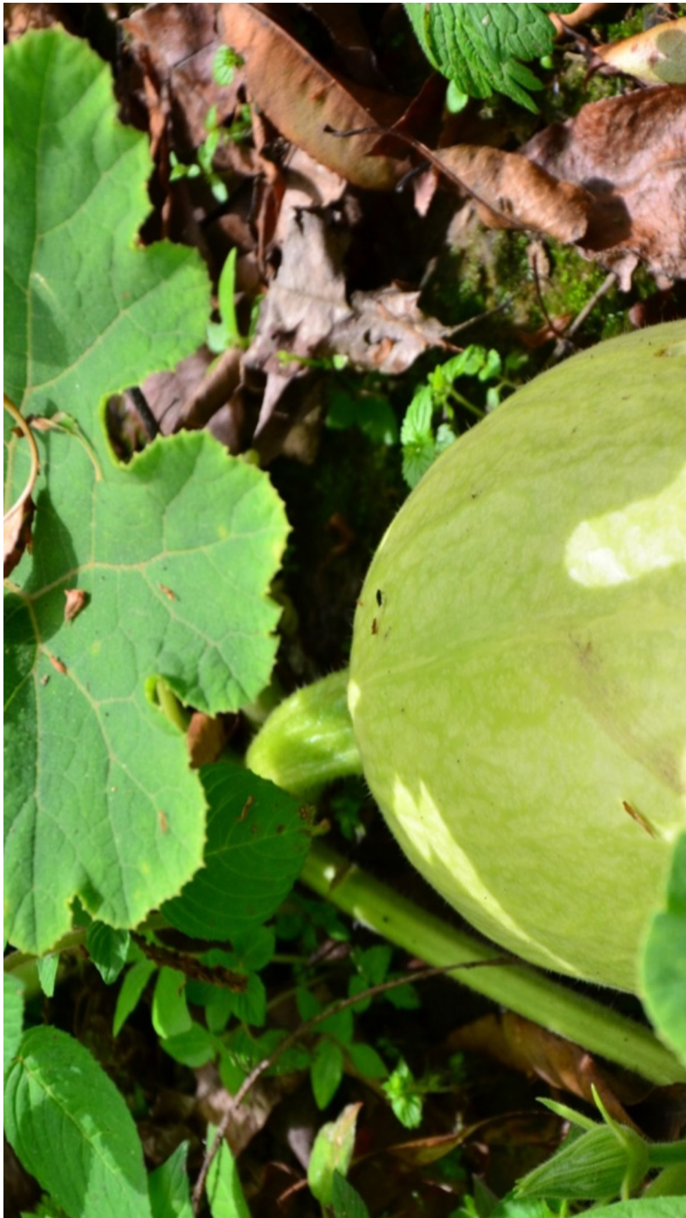
Fotografía 8 y 9. Calabacita. Malinaltepec, Guerrero, agosto 2023.