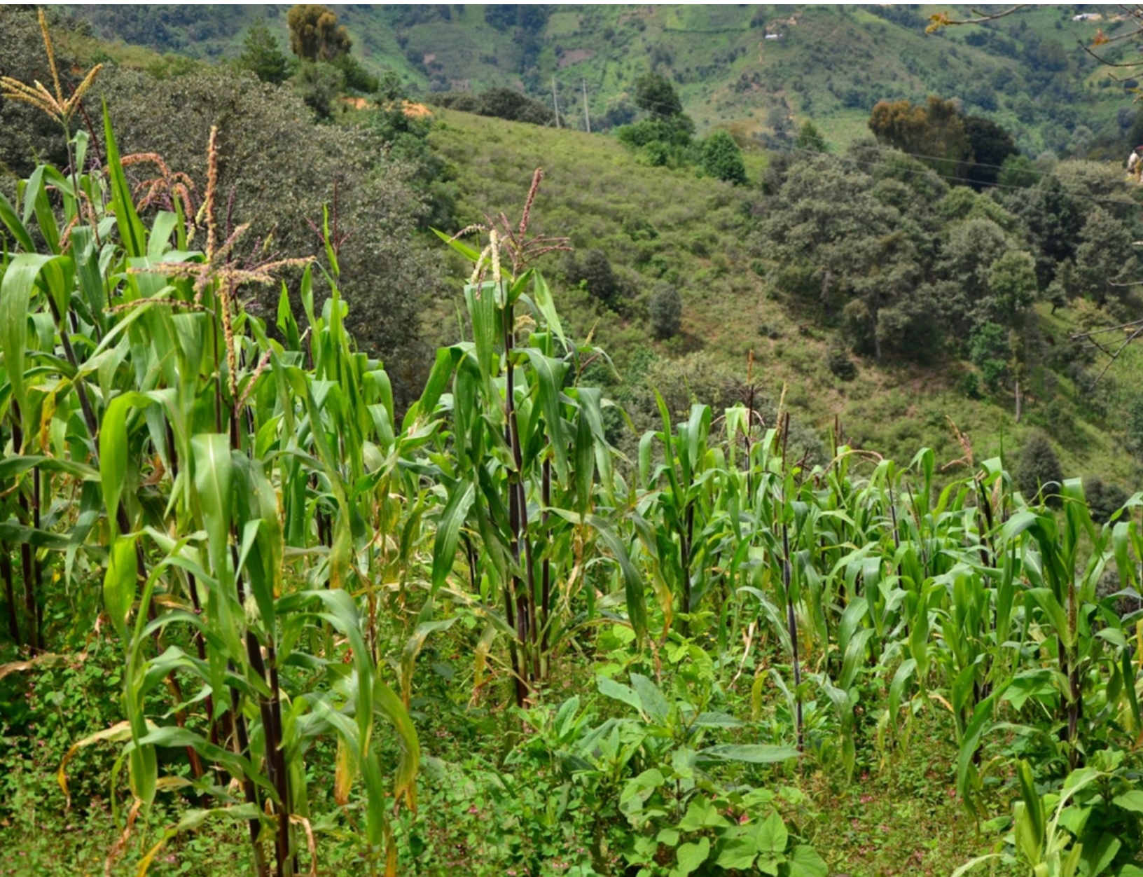
La Milpa. Malinaltepec, Guerrero, septiembre 2021.

Para la milpa de traspatio, la fuerza de trabajo es en un cien por ciento humana y los espacios donde se lleva a cabo tienen que ver con el conocimiento de los diferentes tipos de tierra que distinguen los mè'phàà , que es de hecho uno de los múltiples conocimientos o saberes que poseen para llevar a buen término la siembra de maíz. En la milpa de traspatio se observa un uso generalizado del maíz blanco ( ixí mi'xa ) sembrado en tierra negra ( juba' skuni ), pero también suele sembrarse el maíz morado y azul ( ixí mijñú ), combinado con el blanco o solo, eso depende totalmente del gusto y preferencia de la mujer. En esta parte de la Montaña alta solamente se cuenta con un ciclo de siembra, con dos variaciones climáticas: la temporada seca, que abarca los meses de diciembre hasta abril, denominado tiempo ru'phu ; y la de lluvia, de mayo a noviembre, llamado tiempo ru'wua .