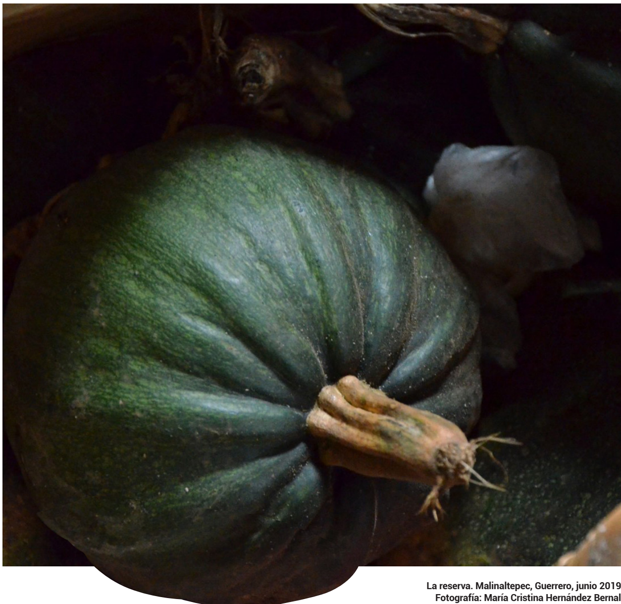
La reserva. Malinaltepec, Guerrero, junio 2019.

San Marcos es un santo católico, su inserción dentro de la ritualidad mè'phàà se debe al proceso de reelaboración y adaptación resultado de la evangelización, que no detallaremos aquí, pero sí se puede caracterizar: San Marcos tiene atribuciones asociadas con la lluvia y se materializa en el mundo: como rayo o trueno que anuncia o más que anunciar trae consigo la lluvia. San Marcos también se manifiesta en rocas ovaladas de diferentes tamaños y piedras de origen prehispánico que son contenedoras de su numinosidad, son pues objetos sagrados que se encuentran en los altares de los cerros, lugares también considerados como la morada de Tata Bègò .