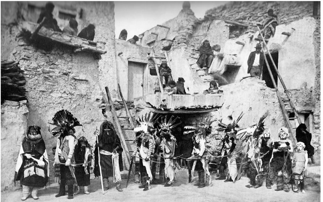
Ilustración 1. Ceremonia Powamuya los kachinas llegan para ayudar al hopi. Walpi Pueblo, Arizona.

Descendientes de los anasazi y parte de la cultura Pueblo, los hopi son profundamente espirituales, con un fuerte respeto por todos los seres vivos y la naturaleza. Su desarrollo cultural es semejante al desarrollo cultural al de Paquimé. Fueron cazadores recolectores antes del año 700 d.n.e. Hacia 850 d.n.e. y posteriormente, estos grupos se unieron para establecer sus primeras aldeas. Para el 1100 en el culto “kachina” (espíritus de las deidades, elementos naturales o antepasados) comenzaron las construcciones de Casas Grandes , definidas por los