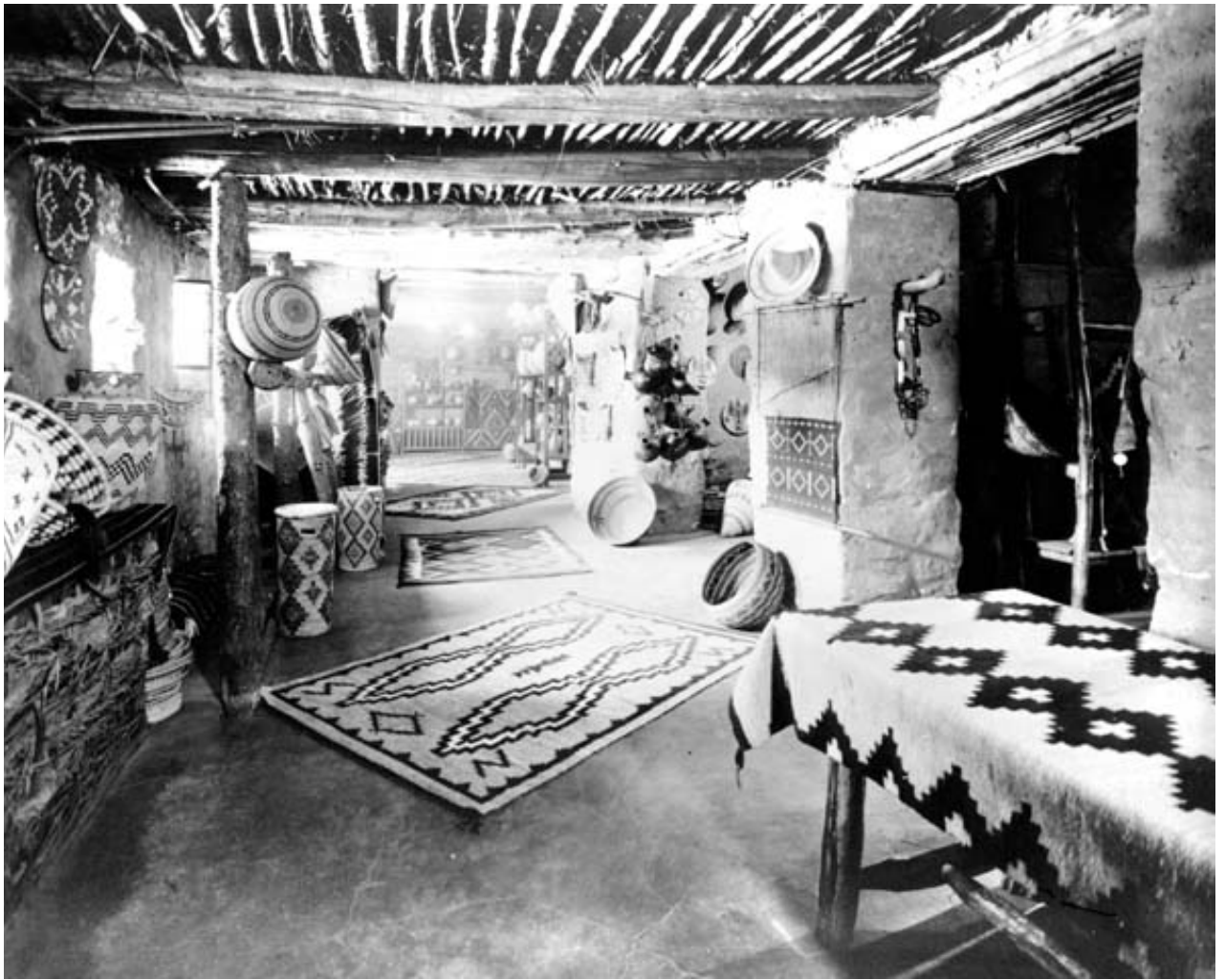
Ilustración 2. Hopi House interior Circa 1905. Grand Canyon National Park, adaptada en 2024. https://www.nps.gov/grca/learn/photosmultimedia/colter_hopih_photos.htm

ilustrados en las representaciones de vasijas y edificios de Paquimé, migraron al sur, acompañados por la “gente kachina”, espíritus que tomaban forma humana para guiar a los clanes. Después de una larga migración, llegaron a la “tierra roja”, donde las deidades les instruyeron a construir “Palátkwapi”, un gran centro religioso y cultural, dividido en tres secciones: el área ceremonial, los almacenes y las habitaciones. Los estudios afirman que Palátkwapi fue Paquimé localizada en el noroeste del actual estado de Chihuahua.