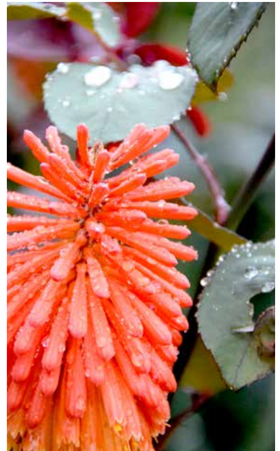
Arareco, Bocoyna, Chihuahua, 2015.

Las enormes nubes flotaban sobre la ciudad con sus miles de litros de agua en forma de vapor. Los ciudadanos parecían conformarse con la fresca sombra que prodigaban. Al final llegó la lluvia como a las seis de la tarde. Pero sin la intensidad con la que fue pronosticada. Llegó apenas una llovizna que se plantó por varias horas. Muchos optimistas, a partir de ese momento, nos quedamos a la intemperie disfrutando la caída de las gotas, esperando que arreciara. Anhelábamos verla correr y formar arroyuelos, como sucedió en otras partes. No fue así, sin embargo, su persistencia regó los campos y contagió de buen ánimo a toda la gente. Su canto pervivió durante gran parte de la noche. Llegó la lluvia. Fue lo importante.