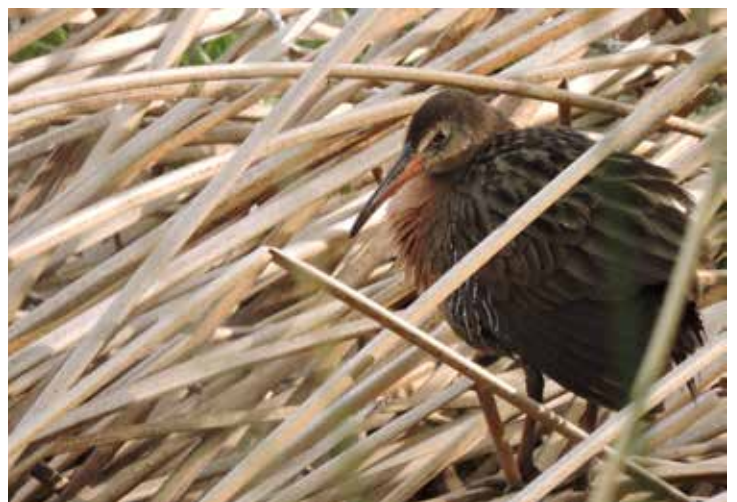
Rascón Azteca ( Rallus tenuirostris ), Río San Pedro-Meoqui, 2023.

Por último, Leonardo afirmó que “observar la naturaleza y su biodiversidad única puede ser una experiencia agridulce; puedes ver lo bello del ecosistema, pero también ves la contaminación, los incendios y la destrucción... Personalmente a mí me marcó cuando por primera vez vi al Rascón Azteca ( Rallus tenuirostris ), ave en peligro de extinción con su pareja y sus polluelos. Fue muy emotivo, es una especie rara, tímida y poco vista; al observarlos, conocer su hábitat y ver su comportamiento diariamente me hizo sentir una conexión emocional. Ante ello no puedes ser indiferente, todos estos seres son alguien, ellos también importan. Concientizar y dar a conocer a la comunidad es primordial para su cuidado, que se conozca la riqueza que tiene Meoqui, solo así podrá cambiar la situación de este humedal”.