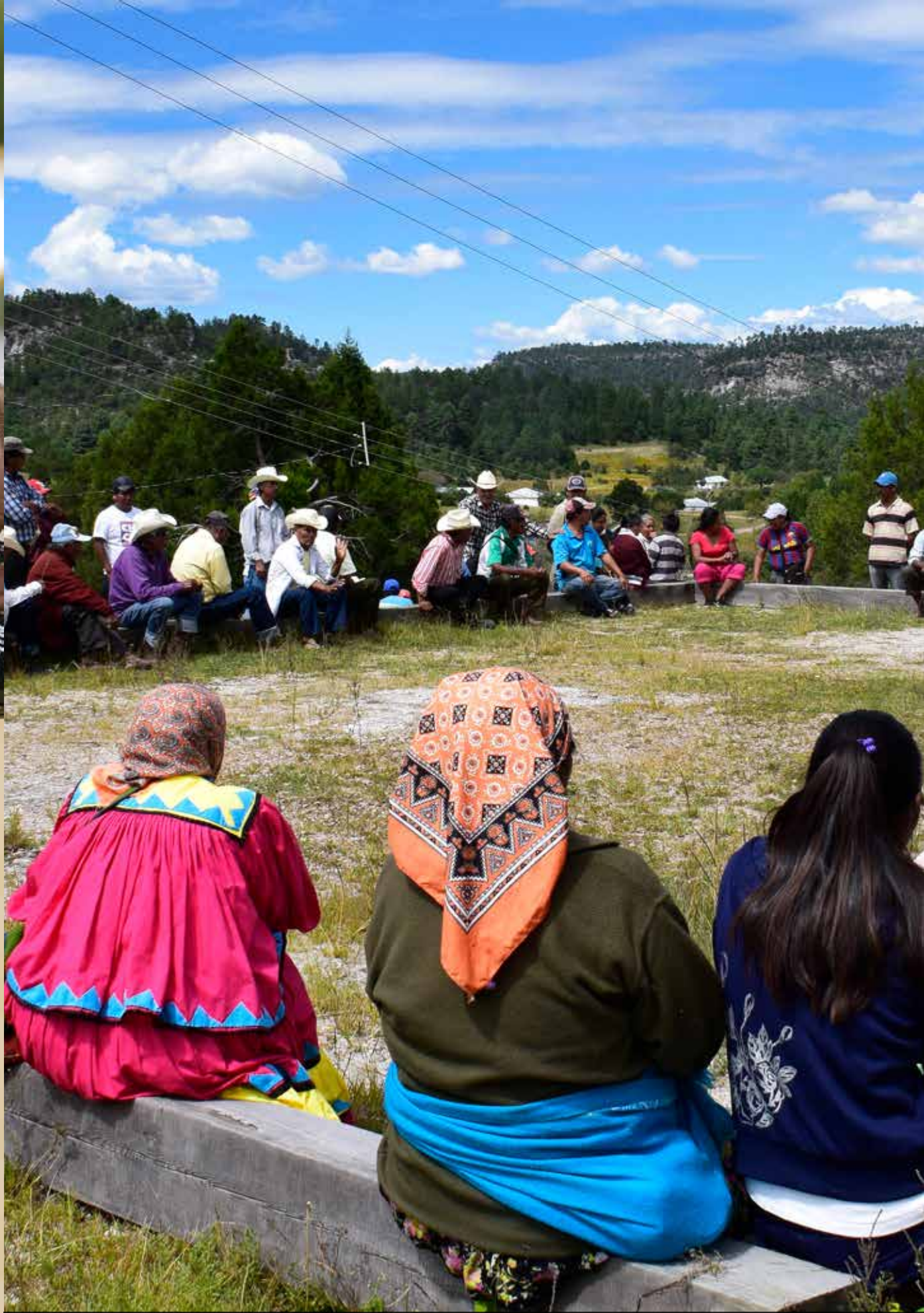
Planeación en la comunidad. Tónachi, Guachochi, 2016.