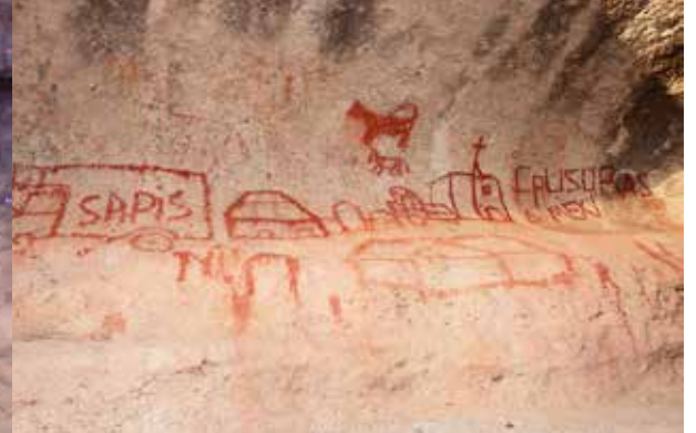
Creel, Bocoyna, Chihuahua, 2009.

El primero, es el de Chomachi o Cho'mari , que significa venado. Se encuentra cerca de Sisoguichi, en lo que es la alta tarahumara. Es una pequeña oquedad rocosa localizada en lo alto de una pared de un pequeño cantil. Tiene forma de una boca; en su fondo aparece la escena de una cacería de un venado con pinturas rupestres en color blanco. A la izquierda y en primer plano, está la representación de un ser humano (antropomorfo) con arco y flecha. El personaje apunta al venado macho de gran cornamenta. A la derecha,