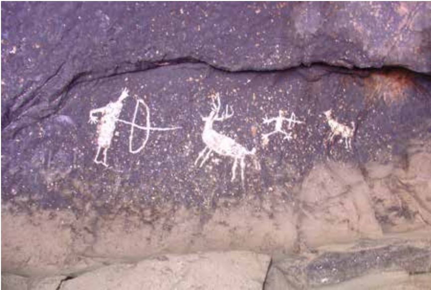
Chomachi, Bocoyna, Chihuahua, 2006.

Francisco Mendiola Galván Arqueólogo Centro INAH Puebla francisco_mendiola@inah.gob.mx