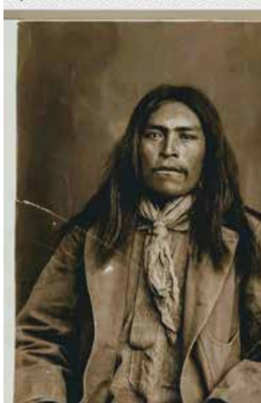
Hombre apache.

lar exclusiva como la cojera o cicatrices prominentes. A pesar de que no se registra el origen étnico de aquellos combatientes, los datos dan indicios de que una parte de ellos pertenecían o eran descendientes de alguna nación indígena de la zona de “la Nueva México” o de alguna otra.