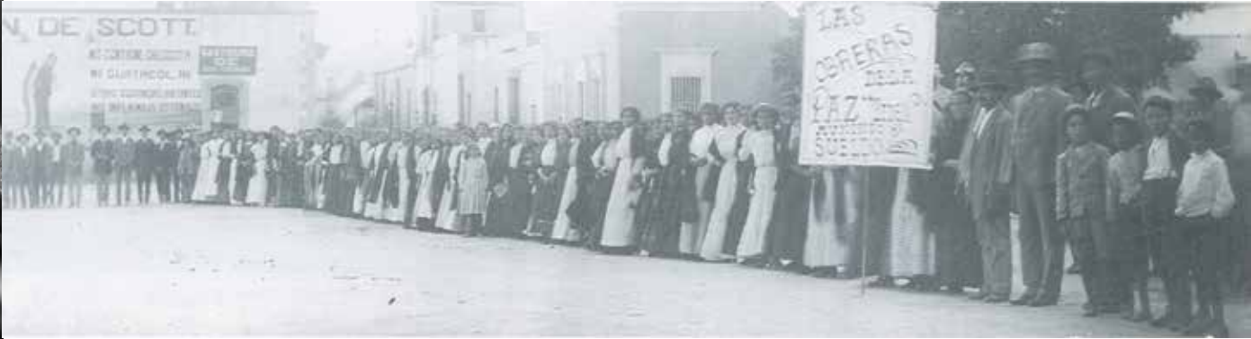
Manifestación de las obreras de la fábrica de ropa “La Paz”, 1911.

Paola Barrera Jorge Meléndez Fernández Conservación fotográfica Centro INAH Chihuahua jorge_melendez@inah.gob.mx