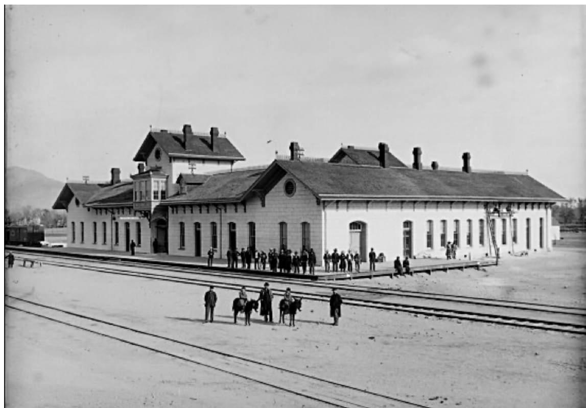
Fig. 1. Estación de pasajeros terminal del Ferrocarril Central Mexicano, Paso del Norte, 1882.

Francisco Ochoa Rodríguez Profesor – Investigador Instituto de Arquitectura, Diseño y Arte Universidad Autónoma de Ciudad Juárez fochoa@uacj.mx