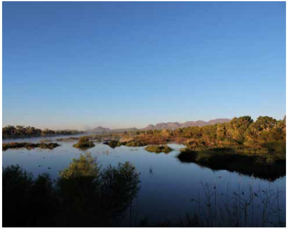
Sitio Ramsar núm. 2047. Río San Pedro-Meoqui, 2024.

En ese mismo sentido agrega “con la edificación de la presa Francisco I. Madero, y los flujos naturales de agua y sus ciclos, desde hace 75 años, generaron las condiciones para el florecimiento de este humedal. Hoy en día está siendo arrasado por la basura, y por obras indebidas que no cuentan con la autorización de Conagua o Profepa. La población no ha aprendido a vivir en armonía con el humedal y las administraciones municipal y estatal no tienen interés de protegerlo.” Este lugar da hogar a 1454 variantes de insectos, 122 de arácnidos, 266 de aves, 26 de mamíferos, 18 de peces, 15 de crustáceos, 668 de plantas, 65 de hongos y 38 de reptiles. De este conjunto 62 especies se encuentran en categoría de riesgo.