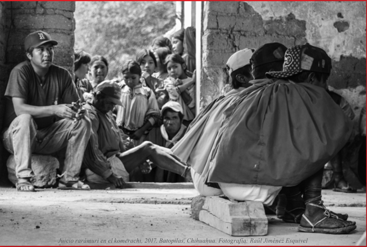
Juicio rarámuri en el komerachi, 2017. Batopilas, Chihuahua.