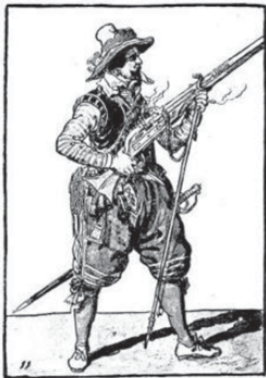
Ilustración de soldado español en la tesis doctoral de Arturo Guevara Sánchez Presidio y población indígena en la Nueva Vizcaya. Siglos XVII y XVIII (Año 2011, pág. 252) . Muestra la posición necesaria para utilizar el mosquete. Nótese el cabello corto y el uso de barba.

El artículo que ahora se comparte surge de la revisión de un documento existente en la Universidad de El Paso Texas que el cronista Manuel Rosales encontró y paleografió, y que trata de una relación de varones que en 1681 recibió su paga por prestar servicios a la Corona en la reducción de los indios rebelados en “la Nueva México” (así se registra en las fuentes escritas).