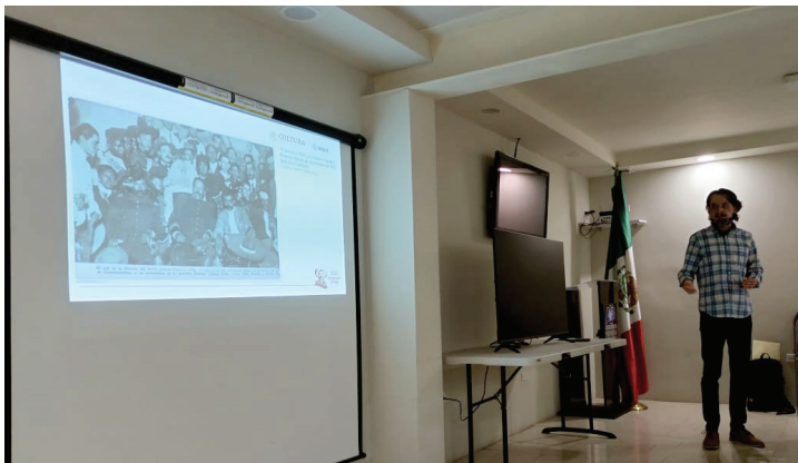
El IX Taller de Periodismo Cultural en la Asociación de Periodistas de Ciudad Juárez, 2023.

Uno de los aspectos que parecen más emocionantes fue la convergencia de las propuestas de estos eventos que sirvieron para que los asistentes conocieran a fondo la herencia que llevamos todos como mexicanos.