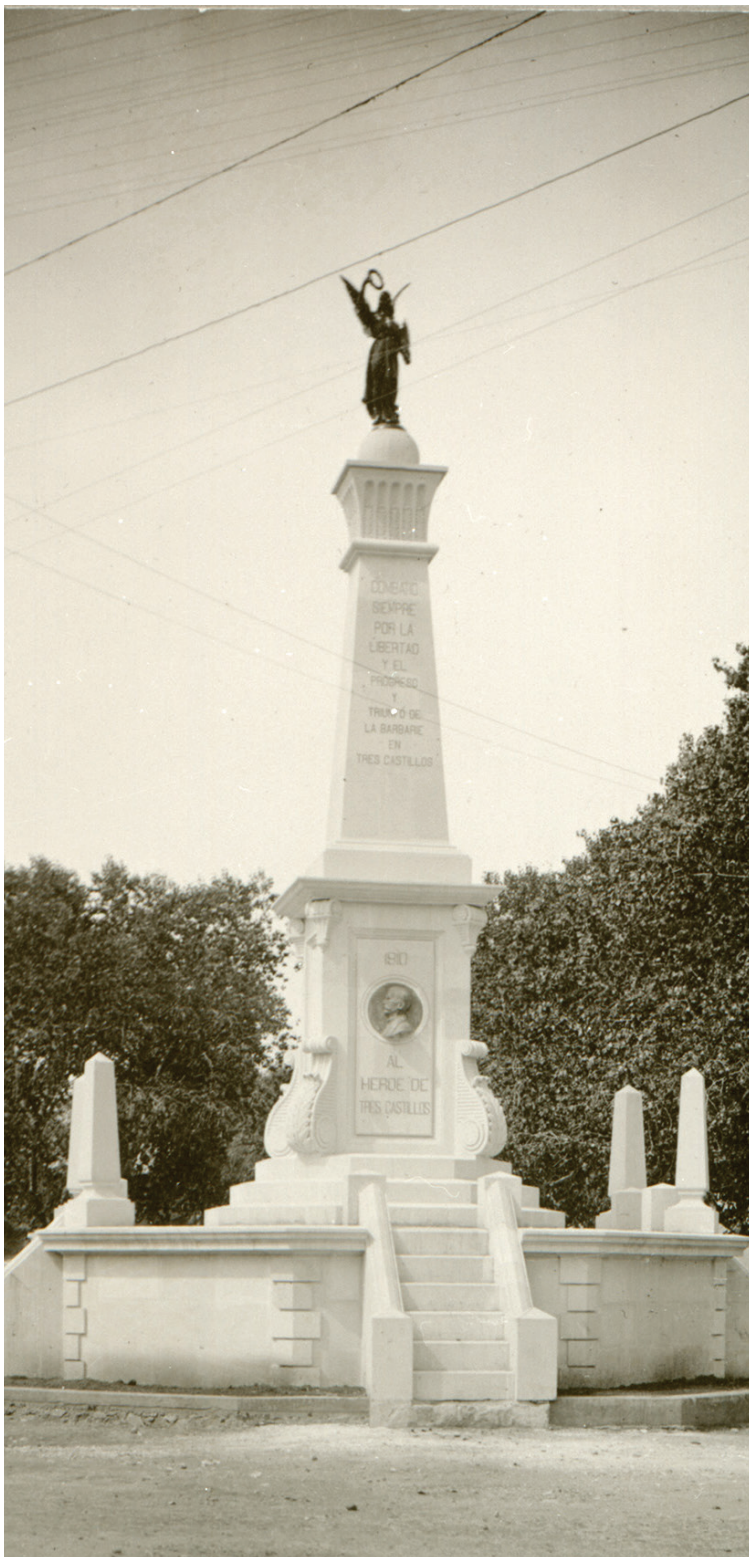
Monumento al Héroe de Tres Castillos, ca. 1915. Inv. RP_0440.

Jorge Meléndez Fernández Conservación fotográfica jorge_melendez@inah.gob.mx