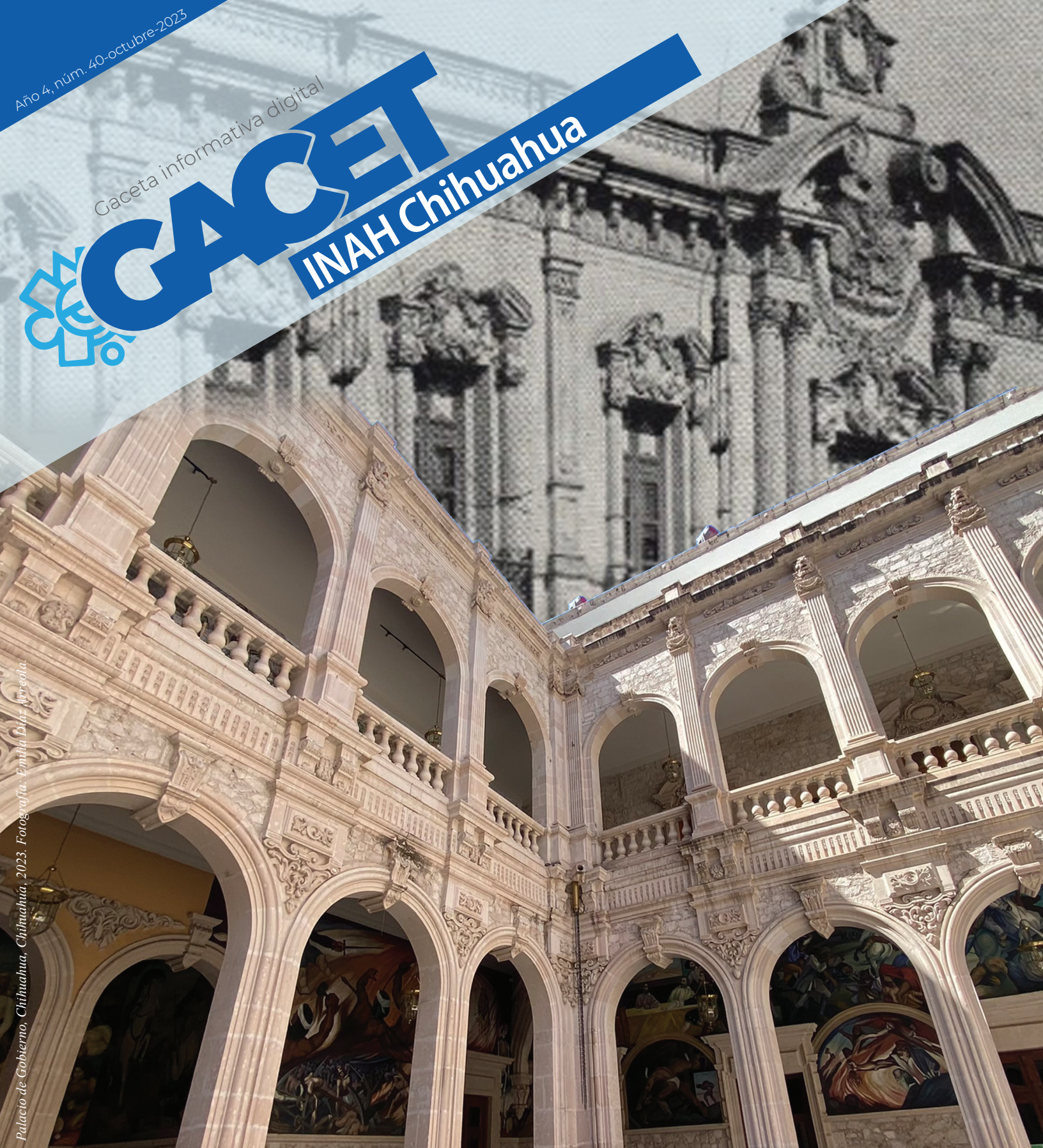
Palacio de Gobierno, Chihuahua, 2023.