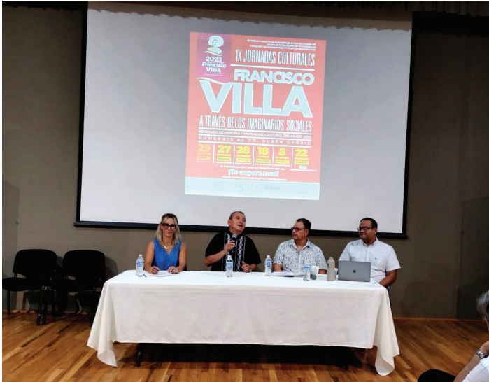
Actividades en las IX Jornadas Culturales de Ciudad Juárez en el Muref, 2023

Chihuahua es conocido por su patrimonio cultural, historia, atractivos naturales y tradiciones que lo hacen ser único en el país. Documentar, conservar y difundir estos bienes representa fortalecer la identidad y orgullo de pertenencia.