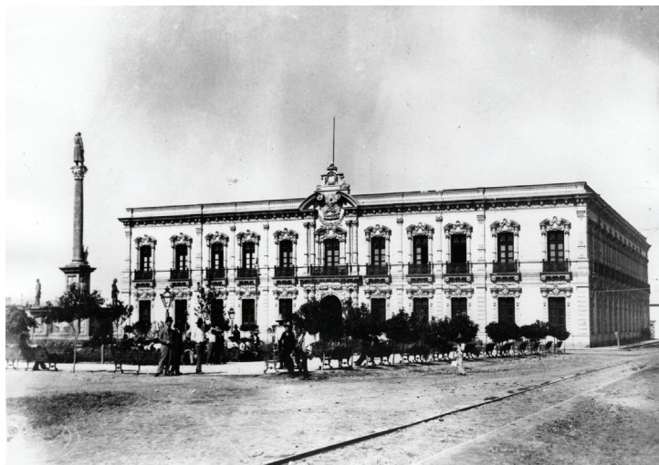
Palacio de Gobierno, ca. 1900. Inv.IMT_08_016