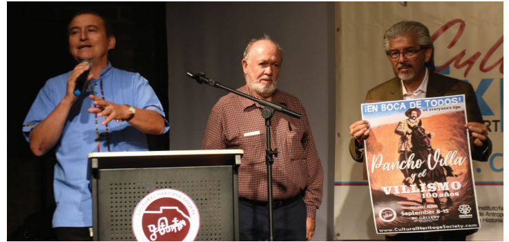
Presentación de la exposición museográfica en San Elizario, Texas ¡EN BOCA DE TODOS! Pancho Villa y el Villismo, 100 años. 2023 Sociedad de Patrimonio Cultural del Camino Real de Tierra Adentro

De estos eventos, fue el 5to Encuentro Binacional del Camino Real de Tierra Adentro, el que unió nuevamente las fronteras de Chihuahua, San Elizario y Socorro, Texas. El 7 de septiembre cuando iniciaron actividades en Ciudad Juárez, especialistas abordaron diferentes temas relacionados al Camino Real y la ciudad de Parral, entre ellos, el papel de las haciendas en la región, la tradición ligada a sus barrios antiguos, el patrimonio del cementerio de Dolores, los bienes culturales presentes en los templos, hasta colecciones fotográficas relevantes.