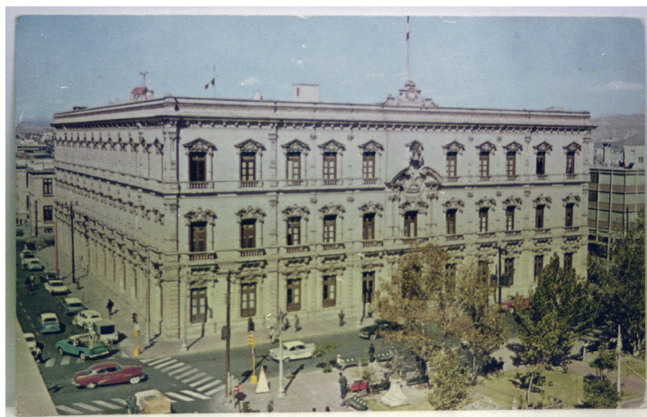
Palacio de Gobierno, ca. 1965. Inv. ChT_2366N.