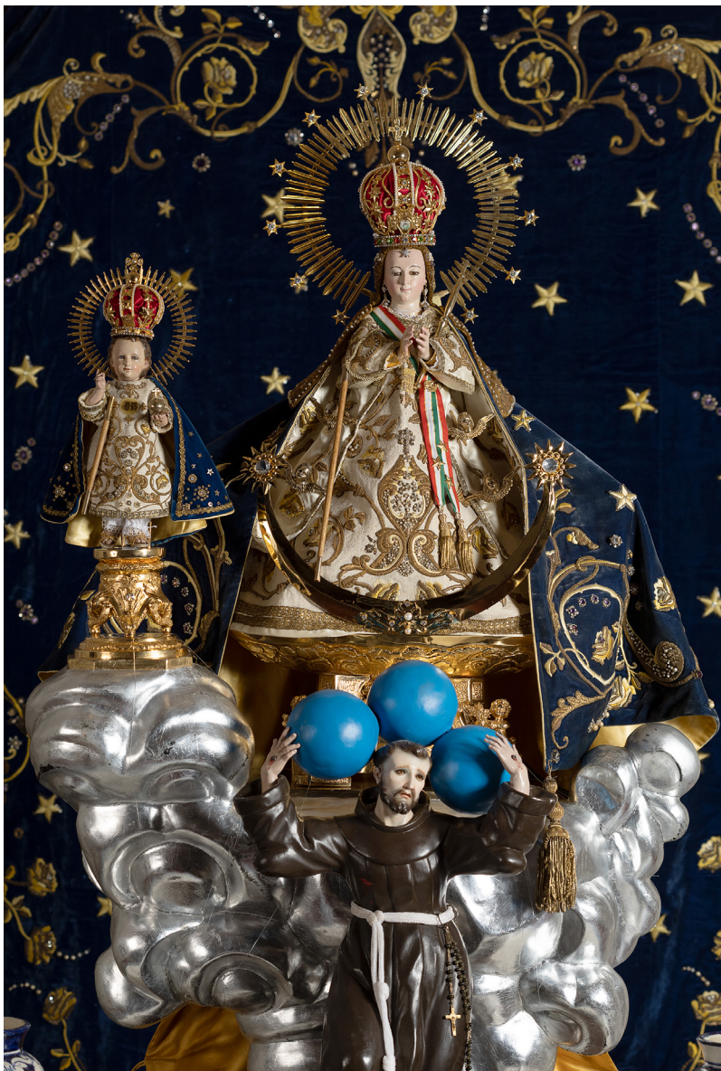
Vicaria con su Santo Niño Autor no identificado Escultura policromada, siglo XVIII Acervo del Santuario de Nuestra Señora del Pueblito (OFM) Corregidora, Querétaro