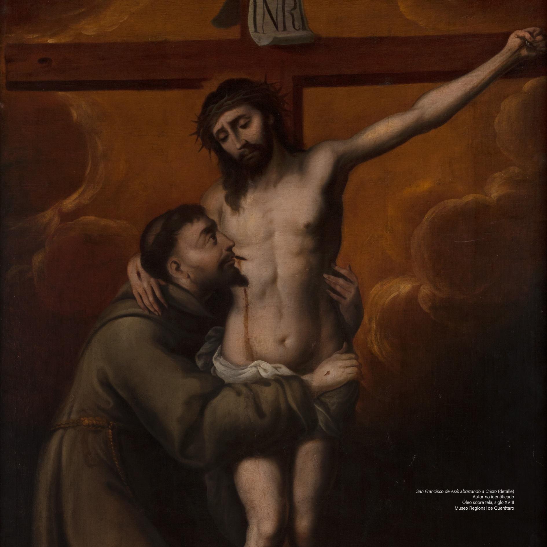
San Francisco de Asís abrazando a Cristo (detalle) Autor no identificado Óleo sobre tela, siglo XVIII Museo Regional de Querétaro