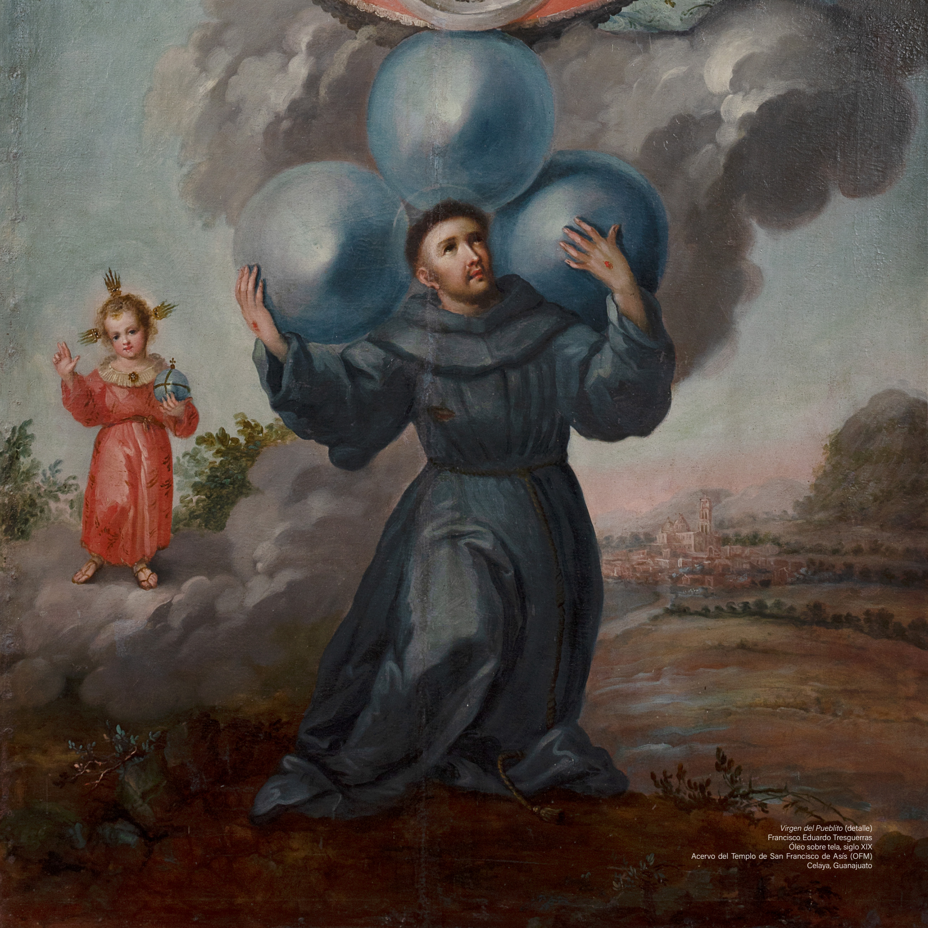
Virgen del Pueblito (detalle) Francisco Eduardo Tresguerras Óleo sobre tela, siglo XIX Acervo del Templo de San Francisco de Asís (OFM) Celaya, Guanajuato