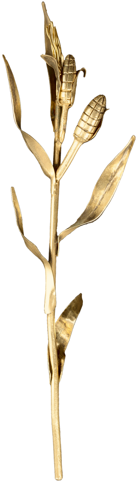
Caña del buen temporal Autor no identificado Plata sobredorada, siglo XIX Acervo del Santuario de Nuestra Señora del Pueblito (OFM) Corregidora, Querétaro