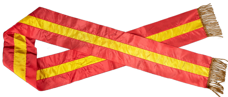
Banda de "Generala" de las Fuerzas Realistas Autor no identificado Textil, 1810 Acervo del Santuario de Nuestra Señora del Pueblito (OFM) Corregidora, Querétaro.