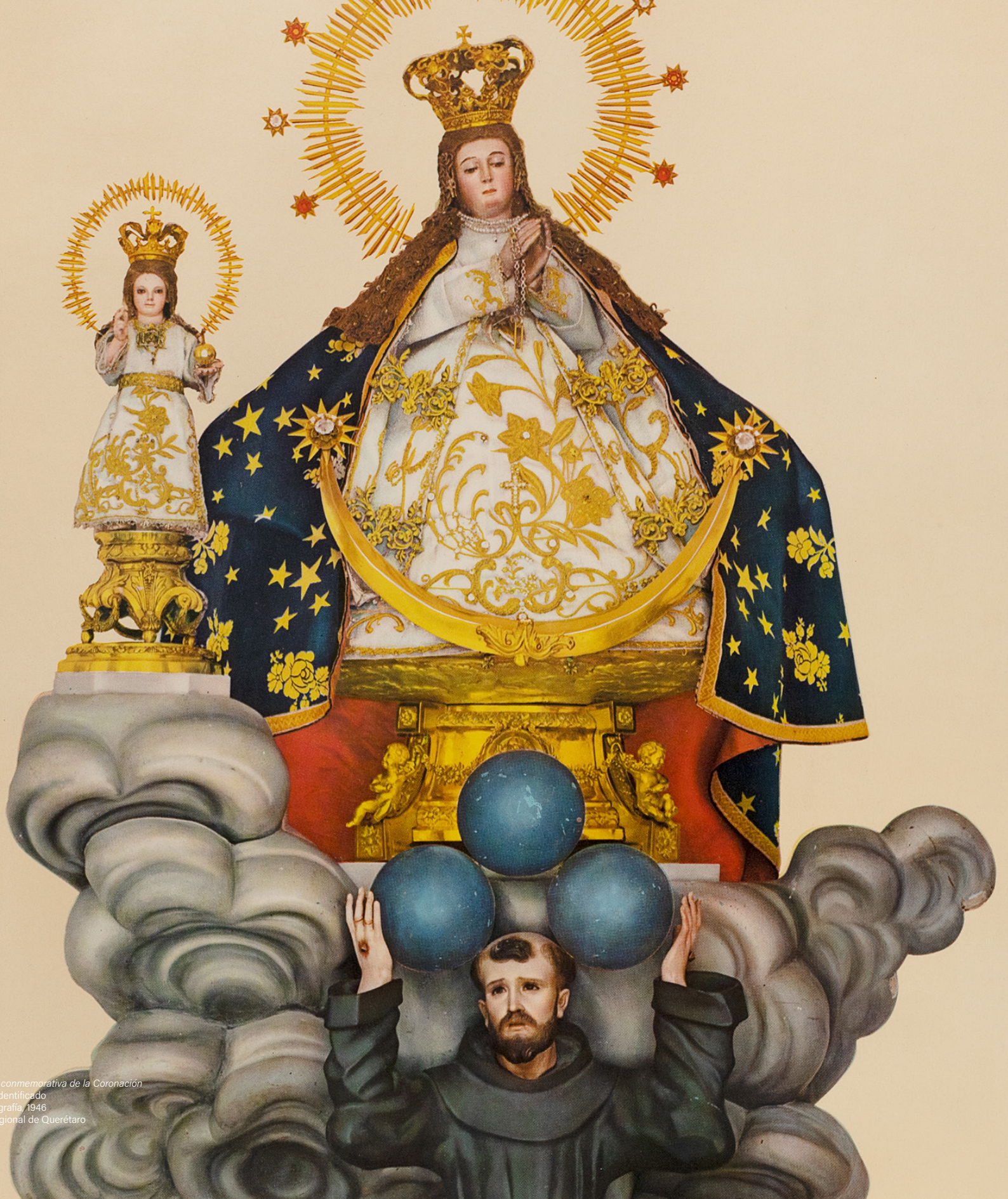
Fotografía conmemorativa de la Coronación Autor no identificado Cromolitografía, 1946 Museo Regional de Querétaro