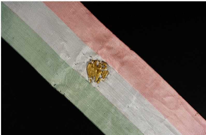
Banda Tricolor ofrecida por Tomás Mejía Autor no identificado Seda con flecos de hilos entorchados, 1865 Acervo del Santuario de Nuestra Señora del Pueblito (OFM) Corregidora, Querétaro

Aquí, fue el escenario principal de los enfrentamientos que culminaron con la caída del Segundo Imperio. Las fuerzas republicanas, comandadas por Mariano Escobedo, impusieron a las fuerzas imperiales un riguroso cerco militar o sitio, que duró más de sesenta días hasta que el 15 de mayo de aquel año, el ejército republicano tomó el control de Querétaro con el famoso “cañonazo” en la cima del Sangremal. El emperador y sus hombres más cercanos, Tomás Mejía y Miguel Miramón, fueron hechos prisioneros, juzgados y posteriormente fusilados en el Cerro de las Campanas.