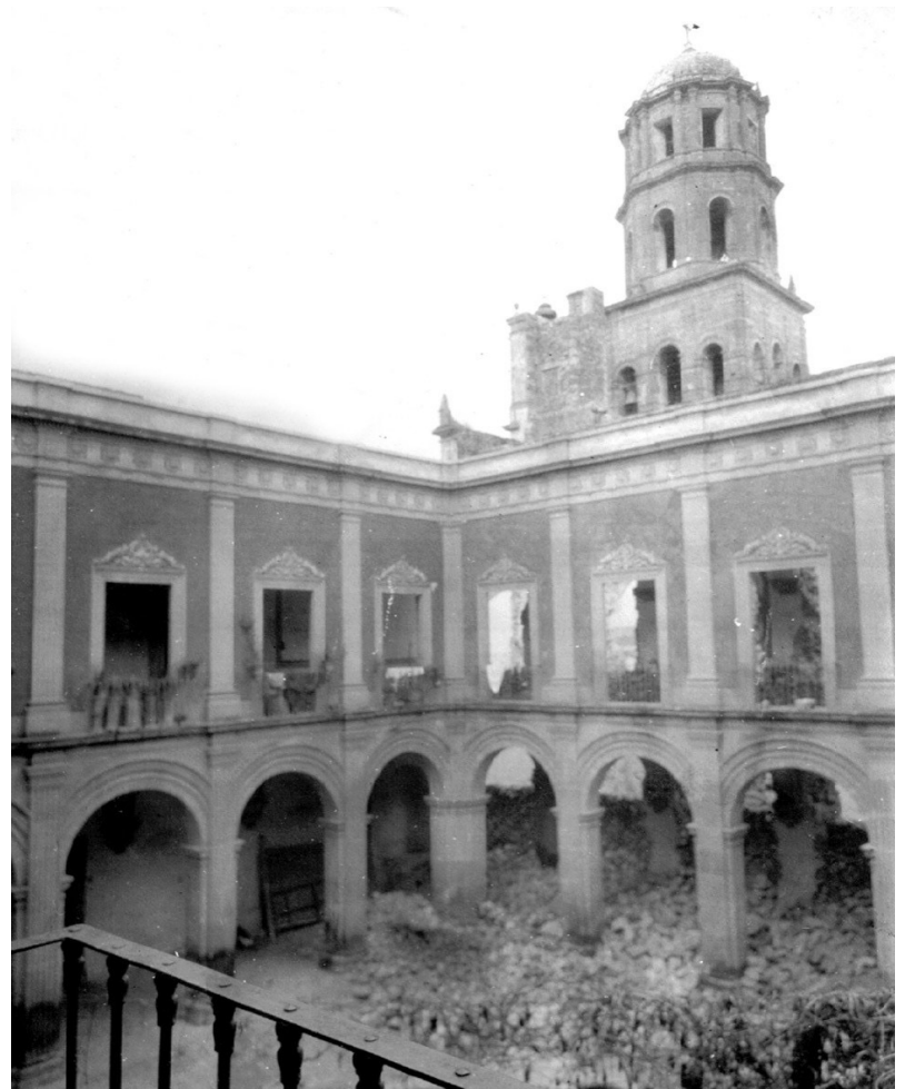
Callejón Aquiles Serdán Autor no identificado Fotografía, 1917 Archivo Esteban Galván

En medio de este contexto bélico, acentuado desde luego por los conflictos internacionales, sucedieron diversos acontecimientos asociados a la restricción de culto, dando lugar a la destrucción de patrimonio histórico y también de muchos bienes procedentes de conventos, templos y colegios religiosos, como por ejemplo la recordada “quema de confesionarios” en el Jardín Obregón. La inestabilidad política y el saqueo, alertaron al sector más conservador de la ciudad quienes en conjunto con los frailes, procedieron a esconder a la “Generala” para librarla de su profanación, daño o robo.