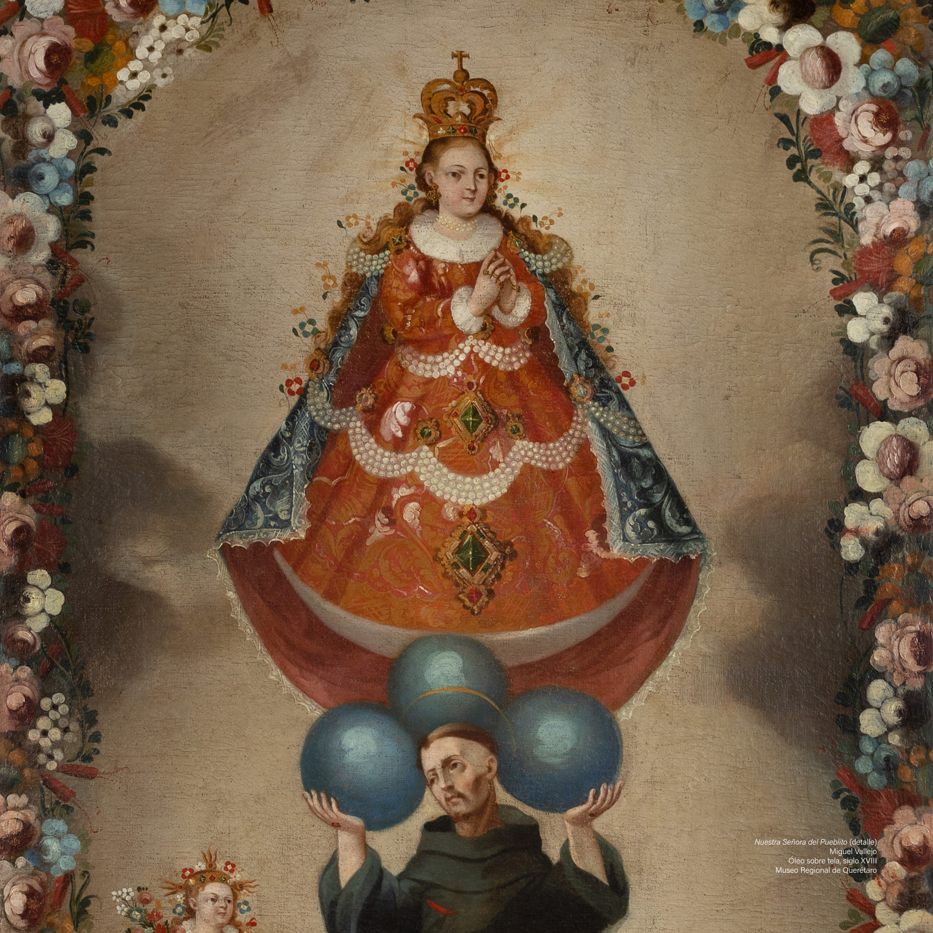
Nuestra Señora del Pueblito (detalle) Miguel Vallejo Óleo sobre tela, siglo XVIII Museo Regional de Querétaro